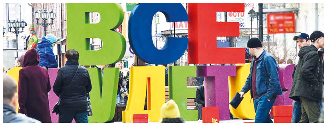
Сумма договора по социальному контракту может составлять от 30 до 250 тысяч рублей

может составить продолжительность действия соцконтракта. Это зависит от выбранного направления.