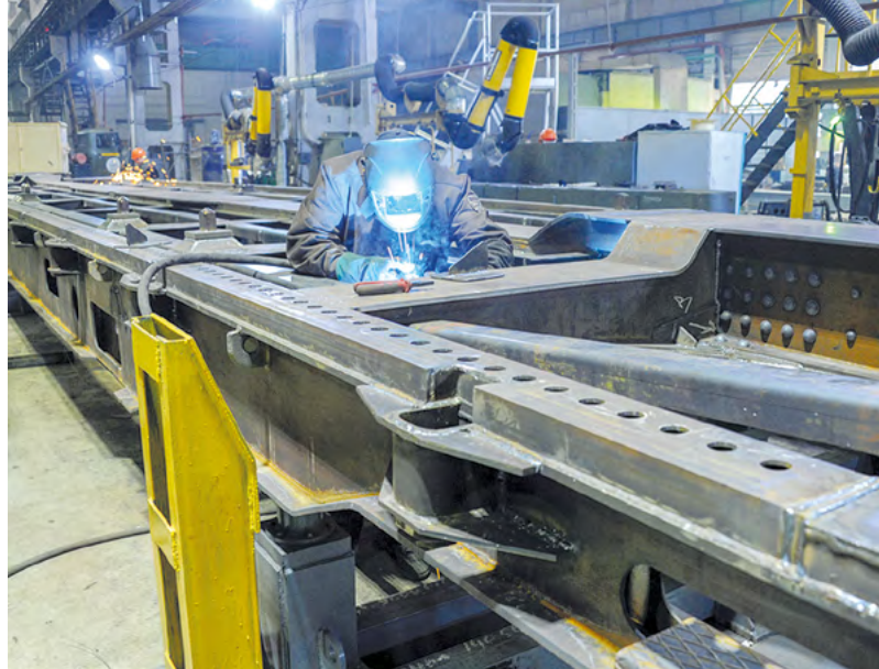
На УВЗ готовятся к выпуску платформ

Он отметил, что руководство Уралвагонзавода с недоумением восприняло сообщения в медиапространстве о якобы нестабильной работе сектора, выпускающего гражданскую продукцию. «Мы работаем стабильно. Гособоронзаказ «под завязку» заполняем. Работаем где-то в две, ино-