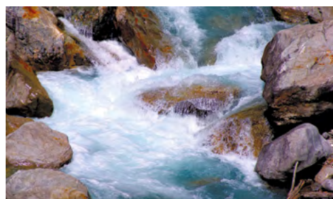
Южаковский водопад в окрестностях Нижнего Тагила

#туризм На Урале предлагают создать маршруты по водопадам, иммерсивные парки отдыха и даже туры по поиску русалок. На конкурс турпроектов «Уральские каникулы», который проходит по инициативе губернатора, поступило более 100 идей от свердловчан по развитию внутреннего туризма. «Конкурс поможет воплотить идеи по развитию альтернатив зарубежным курортам», – рассказал замгубернатора Дмитрий Ионин. Сбор идей идет до 15 апреля на сайте otkroy-ural.com .