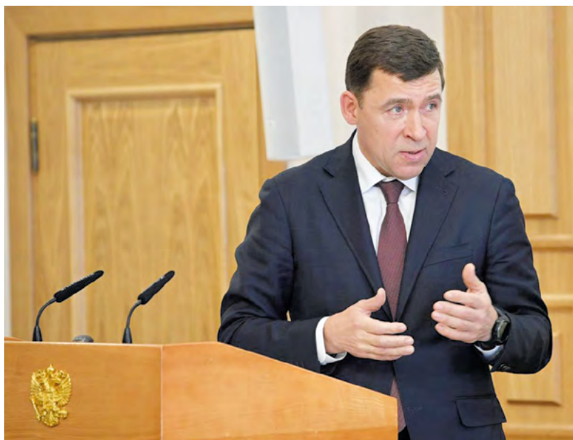
Льготы приблизят покупку газового оборудования для дома.