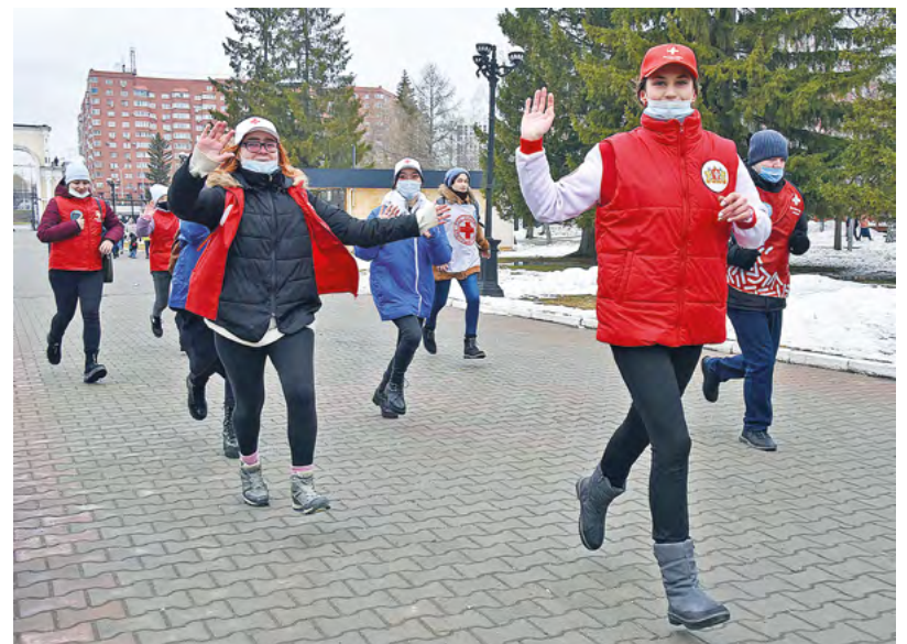
▲ Екатеринбург подключился к Всероссийской акции «10 000 шагов к жизни». Это напомнило горожанам, как полезно проходить 10 тысяч шагов в день. Вместе с уральцами в акции участвовали чемпионка мира, бегунья Ольга Котлярова и призер Олимпийских игр, лыжник Иван Альпов.