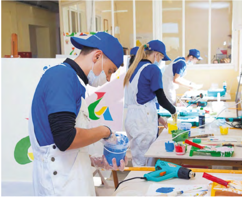
▲ В Екатеринбурге определены победители конкурса детского технического творчества по аддитивным технологиям. Все участники соревнования получили сертификаты, а наиболее талантливые школьники – приглашение на обучение в ведущих вузах страны.

▼ На последнем пусковом участке Екатеринбургской кольцевой автодороги, соединяющей Челябинский и Полевской тракты, ведутся работы по устройству мостового полотна. Строительная готовность объектов составляет 67,7%. Объект будет сдан в эксплуатацию в конце этого года.