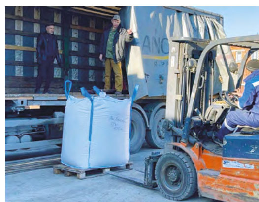
Груз с 10 тоннами яровой пшеницы отправлен с Урала. Поставку гумпомощи курирует реготделение «Российского союза спасателей»

23 апреля отправился новый груз: 5 тонн геркулеса, воды, 4 тысячи продуктовых на-