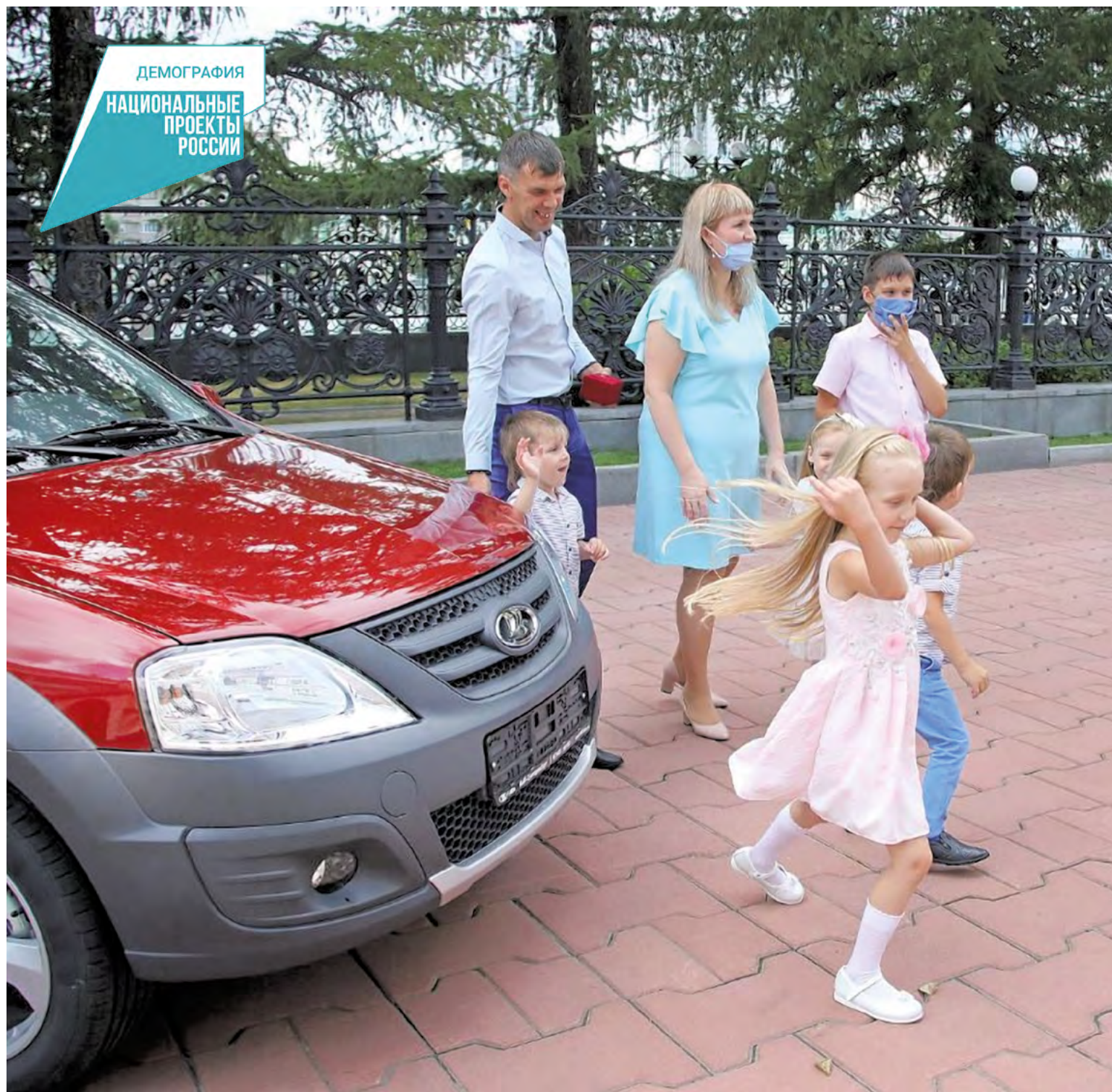
Многодетные семьи свердловчан с большими автомобилями освобождены от транспортного налога