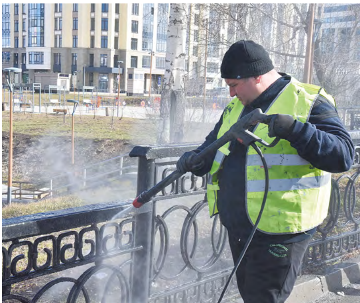
▲ В Екатеринбурге проходит месячник чистоты. Около 400 коммунальщиков приводят в порядок дворы и ливневки. Также моется и красится более 88 тысяч квадратных метров барьерных ограждений.