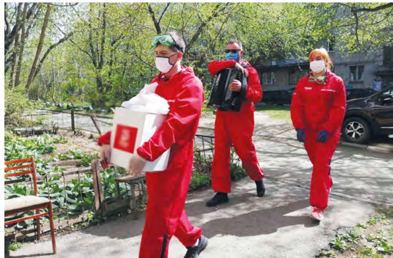
Благодаря инициативе волонтеров в области, как и по всей стране, проходит акция взаимной помощи друг другу #МЫВМЕСТЕ

родского гражданского форума «Стратегия развития города – ответ на вызовы времени»;