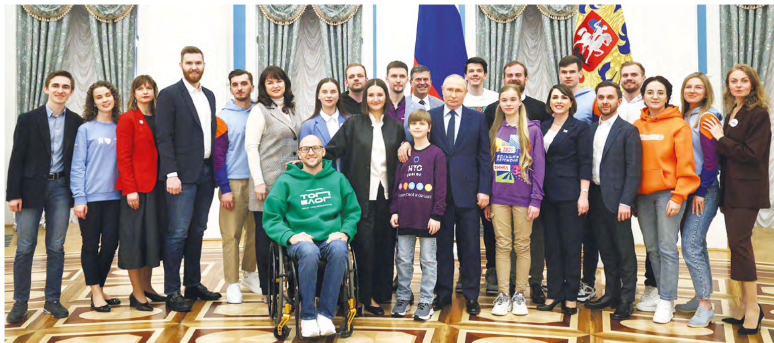
Владимир Путин с участниками платформы «Россия – страна возможностей» в Екатерининском зале Кремля.