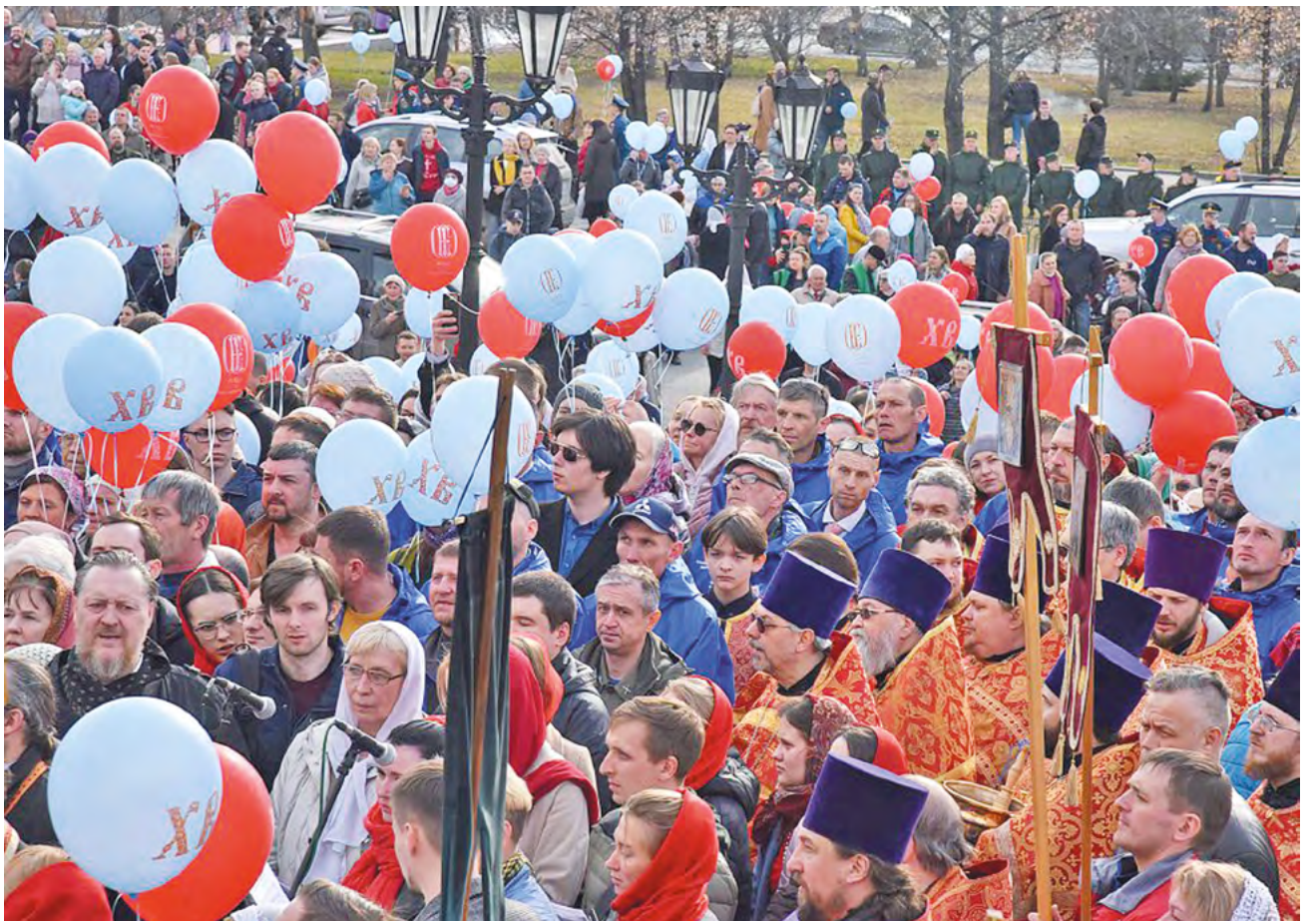
▲ В Екатеринбурге прошел Пасхальный крестный ход. Прихожане шли с хоругвями и иконами, священники несли ковчеги с частицами мощей православных святых: святой великомученицы Екатерины Александрийской, святого праведного Симеона Верхотурского и другие святые, а также Благодатный огонь из Иерусалима.