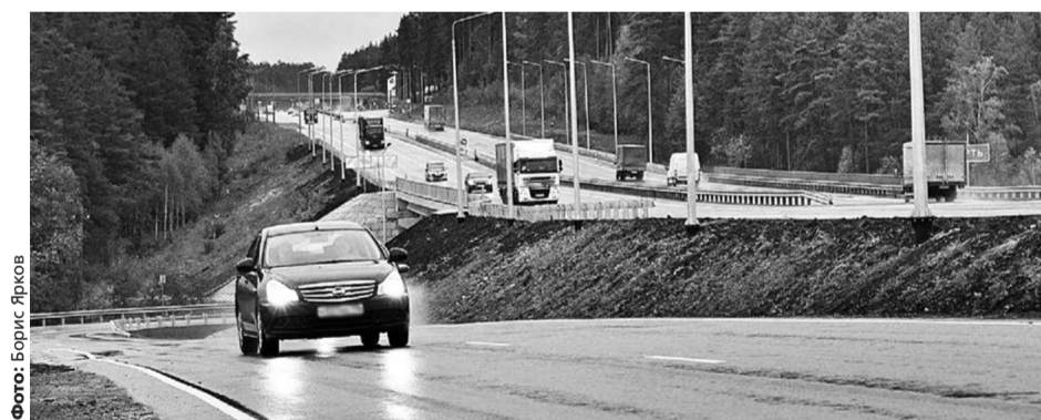
На трассе М-12 автомобили поедут со скоростью не менее 110 км/ч

«Речь не только о транспортном потоке, но и об инфраструктуре, сопровож-