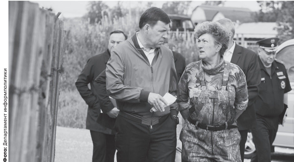
На выплаты жителям подтопленных домов область выделила 22 млн рублей

«Люди сейчас продолжают ремонтировать и восстанавливать жильё. Проведено обследование, больше всего пострадали дома в Верхней Салде. По 86-ти составлены дефектные ведомости, посчитана сумма компенсации. Требуют ремонта 22 дома в Нижней Салде и четыре – в Горноуральском городском округе. На восстановление из бюджета направляется 13,8 миллиона рублей», – отметил Евгений Куйвашев.