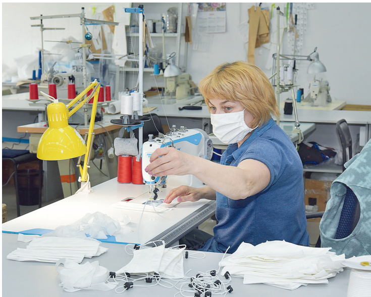
▲ Компания «РУСМЕД» — резидент «Титановой долины» — разворачивает выпуск трехкомпонентных шприцев и медицинских масок. На площадке будет выпускаться более 40 млн единиц продукции в год. При запуске всех производственных линий объем инвестиций составит 426 млн рублей. Будет создано 132 рабочих места.