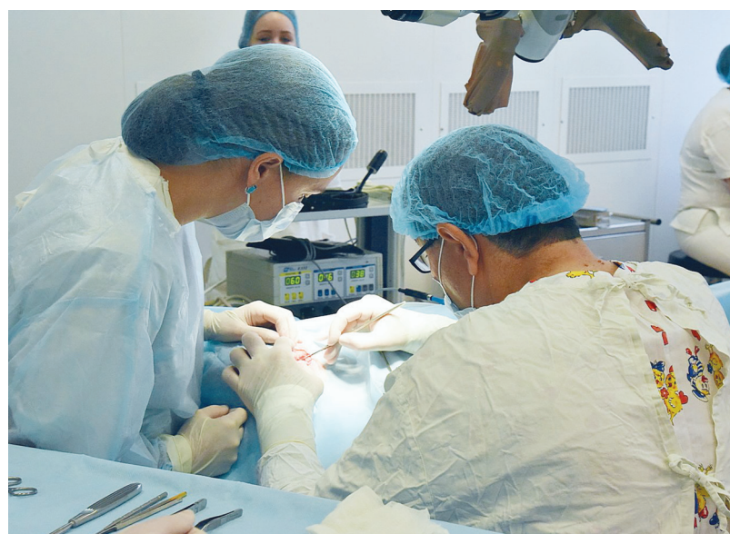
Развитие детской медицины — одна из приоритетных задач нацпроекта «Здравоохранение», который стартовал в России в 2019 году. Врачи ДГКБ № 9 ежегодно оказывают медицинскую помощь более 36 тысячам детей.

Основное применение аппарата — литотрипсия — дробление камней любой плотности. Кроме этого, с помощью лазера можно разрезать ткани и даже удалять опухоли.