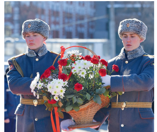
▲ В Свердловской области отметили День народного подвига по формированию Уральского добровольческого танкового корпуса. Губернатор возложил цветы к памятнику уральским танкистам на Привокзальной площади в Екатеринбурге. Также корзины цветов возложили солдаты роты почетного караула ЦВО.

▼ В Екатеринбурге прошел автопробег в поддержку спецоперации на Украине. Автолюбители проехали по центральным улицам города с флагами ДНР и ЛНР, российским триколором и буквой Z. Организовали акцию отделения «Офицеры России» и «Сильная Россия».