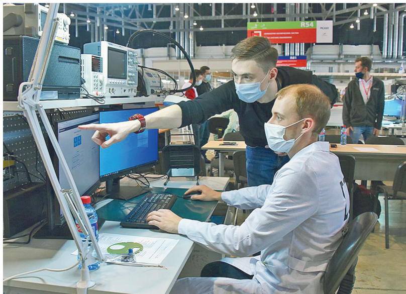
Все работодатели по-прежнему будут обеспечивать соблюдение санбезопасности на своих участках работы.