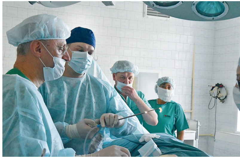
В госпитале ветеранов войн появились сразу два аппарата для очищения крови.