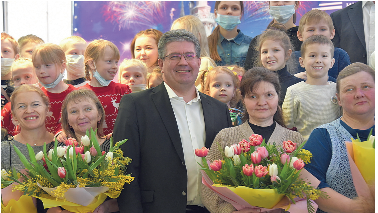
▲ Мамы, награжденные знаком «Материнская доблесть» 1 степени, на встрече с министром соцполитики региона Андреем Злоказовым поблагодарили областное правительство за поддержку многодетных семей. Эти женщины воспитывают 10 и более детей. В 2022 году к знаку «Материнская доблесть» 1 степени свердловчанки получают пособие в размере 171 942 рубля.