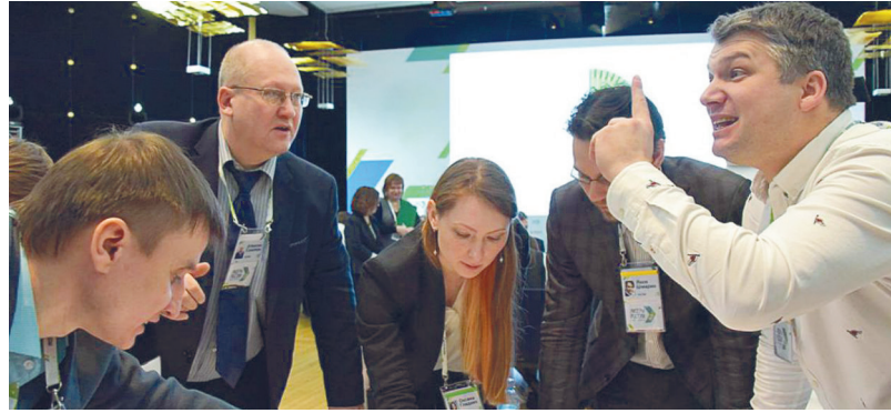
В области разрабатывают меры поддержки малого и среднего бизнеса

«Мы можем говорить о том, что у нас неплохое взаимодействие бизнеса и власти в Свердловской области. Я считаю, что это один из самых лучших примеров в нашей стране. Но вот эти новые вызовы потребуют