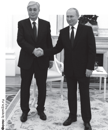
Выставка на Урале сделает связь России и Казахстана еще крепче

Президент РФ Владимир Путин по итогам двусторонних консультаций с Президентом Казахстана Касым-Жомартом Токаевым высоко оценил планы Казахстана выступить в качестве страны-партнера при проведении в Свердловской области в 2022 году международной промышленной выставки ИННОПРОМ.