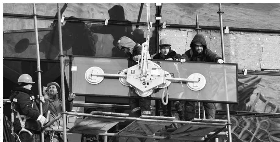
Деревня Универсиады разместится на площади в 30 гектаров