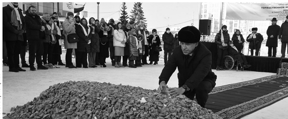
Перед Синагогой будет возведен монумент в память о жертвах Холокоста, с благодарностью воинам Красной Армии и труженикам тыла, победившим нацизм

Полное его название — монумент в память о жертвах Холокоста, с благодарностью воинам Красной Армии и труженикам тыла, победившим нацизм. Территорию у Синагоги планируется