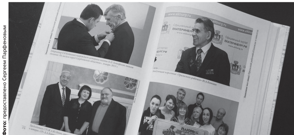
Книга создавалась всем миром. Это — плод дружных усилий почти 30 авторов

Книга создавалась всем миром. Это — плод дружных усилий почти 30 авторов. Причем среди них не только бывшие руководители, сотрудники «УР» разных лет и эпох, проживающие ныне во многих городах и всях страны, но и внештатные корреспонденты