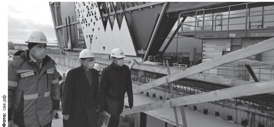
Евгений Куйвашев проверил, как возводится Деревня Универсиады, которая затем станет кампусом УрФУ

«Для нас большая честь и ответственность быть в числе первых регионов, где в скором времени появятся су-