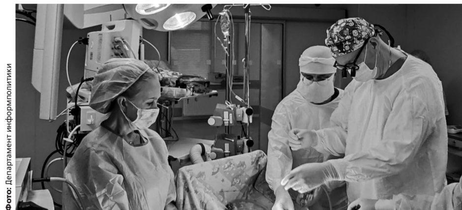
Таковую операцию могут провести не более десяти ведущих клиник мира