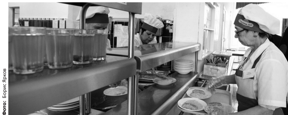
В этом году на организацию бесплатного питания для учеников начальной школы и детей-льготников выделено более пяти миллиардов рублей

— Обычно дети находятся в школе не более шести часов, и им положен один прием пищи: школьный завтрак или обед — в зависимости от смены. Если же ребенок учится больше шести часов или остается в школе на дополнительные за-