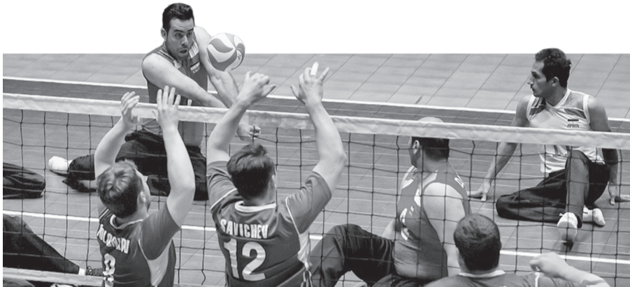
Мужская сборная по волейболу сидя поборется за самые высокие награды