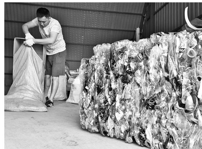
В отрасли переработки пластика нужны кадры. Каждого новичка приходится обучать различать пластик 80 видов.

— Вы зарабатываете на том, что продаете отсортированное и спрессованное сырье переработчикам. Насколько широк круг ваших деловых партнеров?