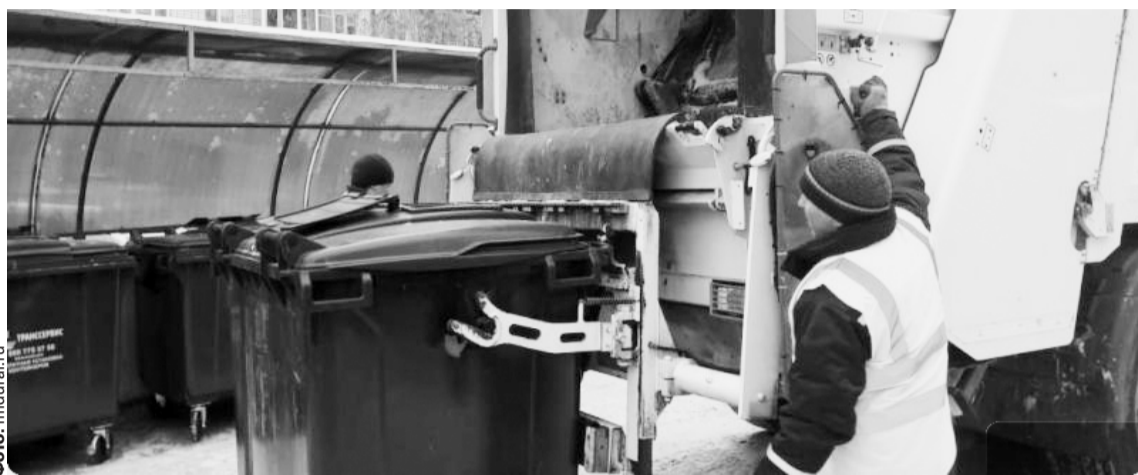
На уборку свердловских городов вышли мусоровозы, оснащенные современными системами навигации, способные вместить от 120 до 150 кубометров ТКО.