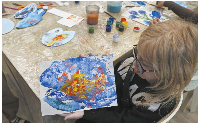
53 проекта Свердловской области получили гранты Президентского фонда культурных инициатив на сумму 160 миллионов рублей.

Только за 2023 год на Среднем Урале по нацпроекту были созданы пять модельных