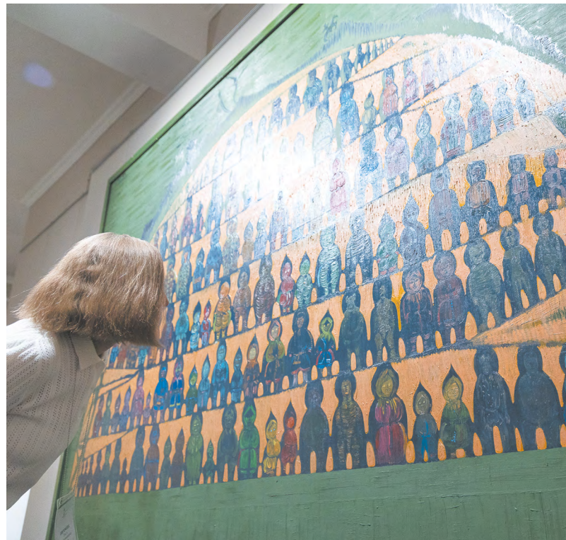
▲ В Екатеринбургском музее изобразительных искусств открылась выставка «Властитель Югры. Живопись и графика Геннадия Райшева».