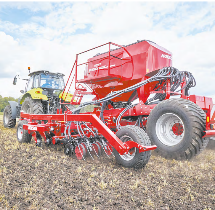
▲ Земледельцы Среднего Урала завершили посевную кампанию: площадь ярового сева составила почти 500 тысяч гектаров.