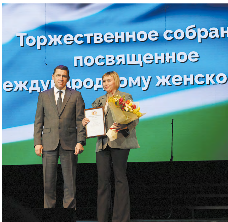
▲ Губернатор Евгений Куйвашев поздравил уралочек в преддверии Международного женского дня.