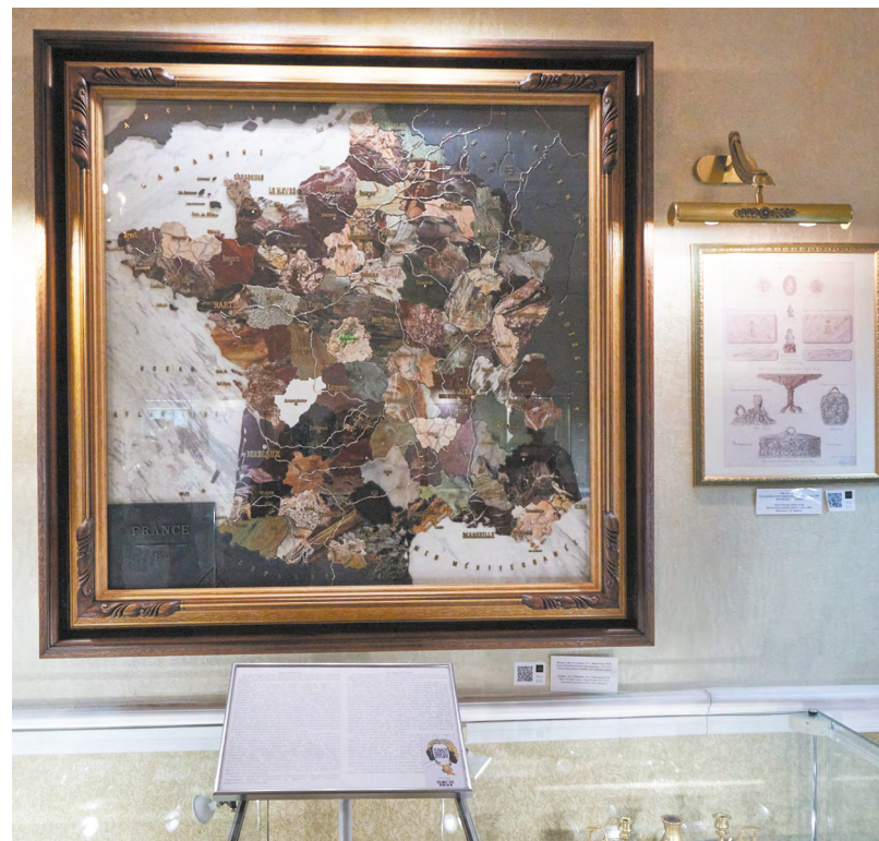
▲ «Баховские коллекции» фестиваля Bach-fest представлены в Музее истории камерного и ювелирного искусства.