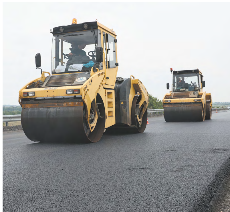
Из 32 тысяч километров дорог Среднего Урала 81 процент уже имеет покрытие из асфальтобетона.