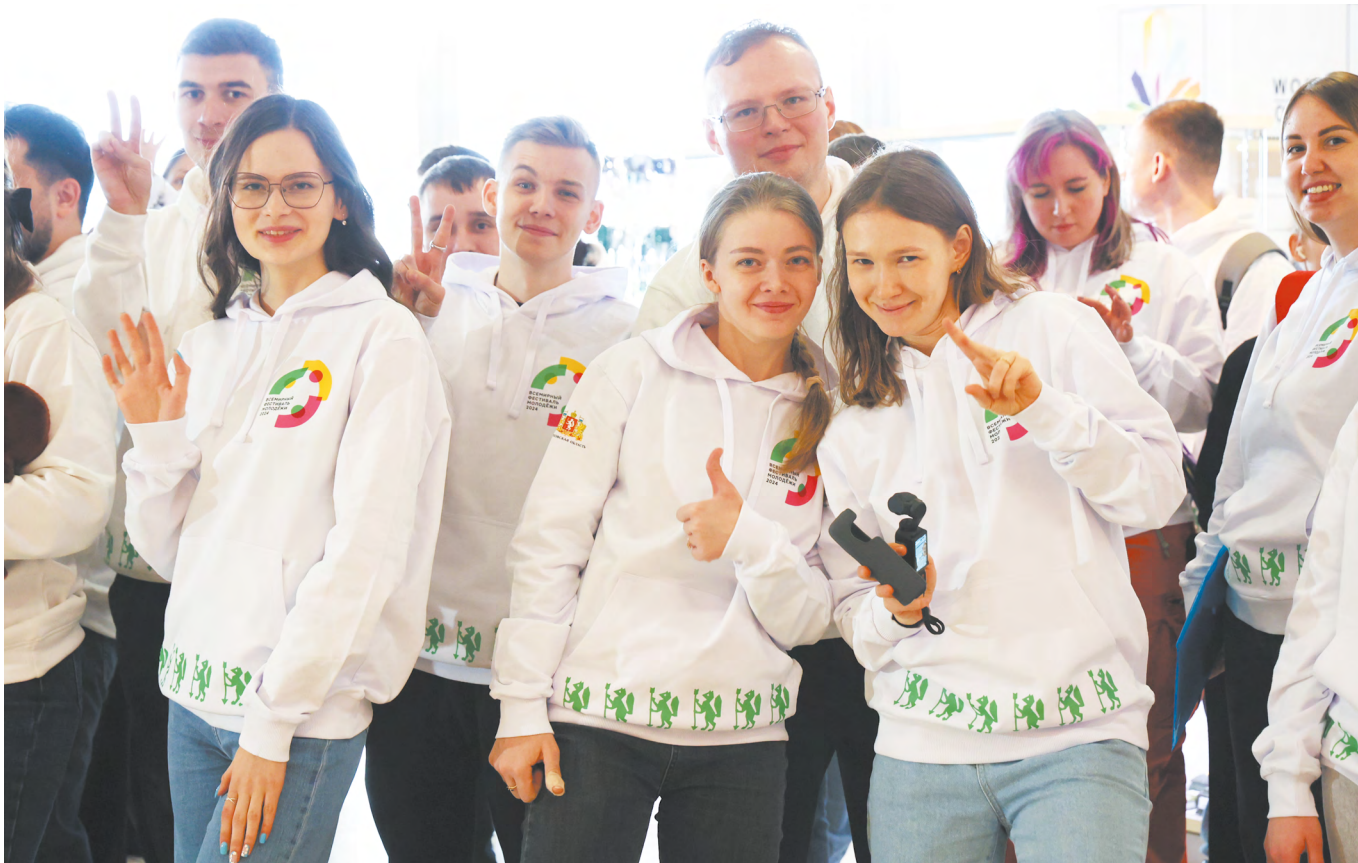
▲ 135 свердловчан в числе 20 тысяч единомышленников со всего мира принимают участие во Всемирном фестивале молодежи.