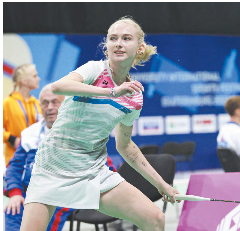
▲ Более 400 спортсменов из 25 регионов приняли участие во Всероссийском турнире «Мемориал А.Ф. Трубачева» по бадминтону.