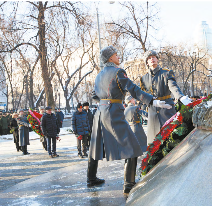
▲ Евгений Куйвашев возложил цветы к памятнику Георгию Жукову в честь Дня защитника Отечества.