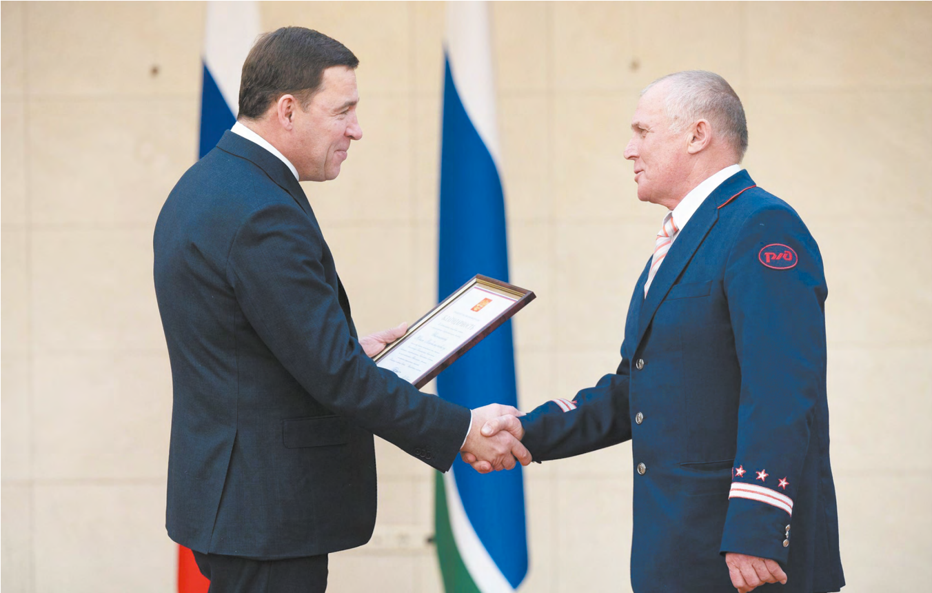
▲ Выдающиеся жители Свердловской области получили государственные награды и знаки отличия.