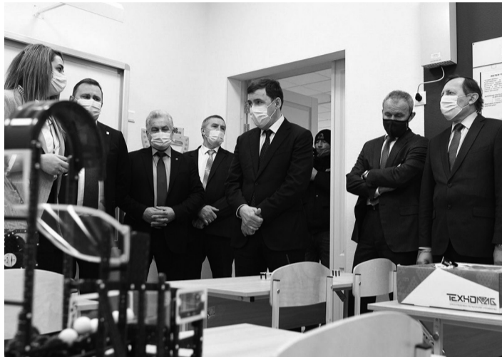
Новые детсады и отремонтированные школы губернатор назвал серьезным стимулом для молодых семей

Нижний Тагил готовится к 300-летию. Губернатор Свердловской области Евгений Куйвашев обсудил с руководством города ход подготовки к знаменитому событию.