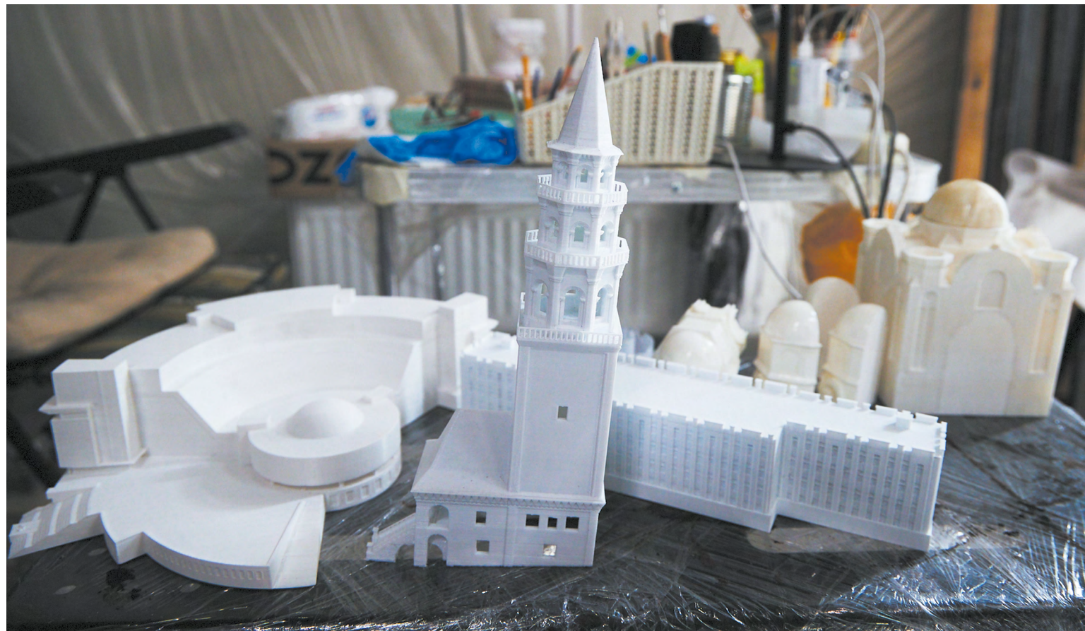
Стенд Свердловской области начали монтировать в Екатеринбурге, затем работа продолжилась в столице — в павильоне ВДНХ.

#Семья Сотни уральских семей, отпраздновавших золотую свадьбу, отмечены знаком отличия «Совет да любовь». Губернатор Евгений Куйвашев подписал указ о награждении еще 250 пар, отметивших золотую свадьбу. Вместе с наградой оба супруга также получают по пять тысяч рублей. С 2011 года, когда награду начали выдавать в Свердловской области, знак «Совет да любовь» получили более 65 тысяч семейных пар. Он представляет собой восьмиконечную звезду с расходящимися от ее центра позолоченными лучами. На оборотной стороне помещена надпись рельефными буквами: «Совет да любовь».