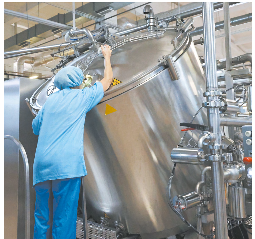
▲ Производитель одного из брендов уральской столицы — майонеза ЕЖК — отметил День работников пищевой промышленности.