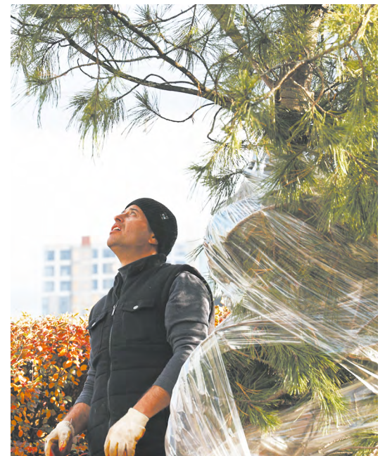
▲ В Екатеринбурге на Плотинке между Домом Севастьянова и гимназией №9 высадили молодые кедры.

▼ В Музее истории Екатеринбурга стартовал проект «Вскрытие показало»: демонстрации предметов, извлеченных из Капсулы времени в год 300-летия уральской столицы.