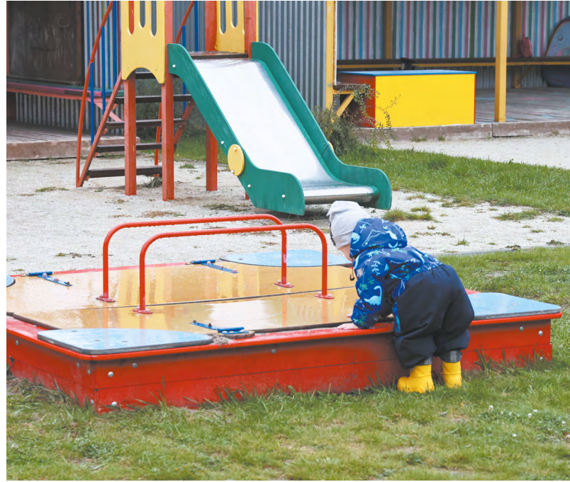
Дополнительные средства планируется направить на благоустройство объектов, которые выбрали самими свердловчане.

В 2024 году планируется качественно преобразить 24 двора и 27 общественных территорий в муниципалитетах Свердловской области. Дополнительные средства, предусмотренные по итогам первого этапа согласительных процедур, планируется направить в первую очередь на объекты, которые были выбраны по итогам рейтингового голосования самими горожанами.