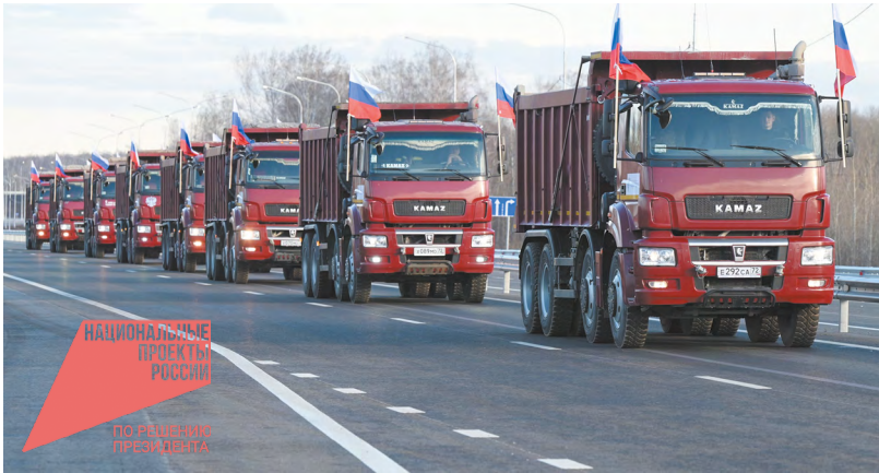
Участок трассы Р 351 «Екатеринбург – Тюмень» в Свердловской области с 88-го по 105-й километр построен с опережением графика