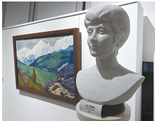
▲ В трех залах «Главного проспекта» разместились работы Николая Рериха – художника, сценографа, философа, писателя, путешественника, археолога, общественного деятеля