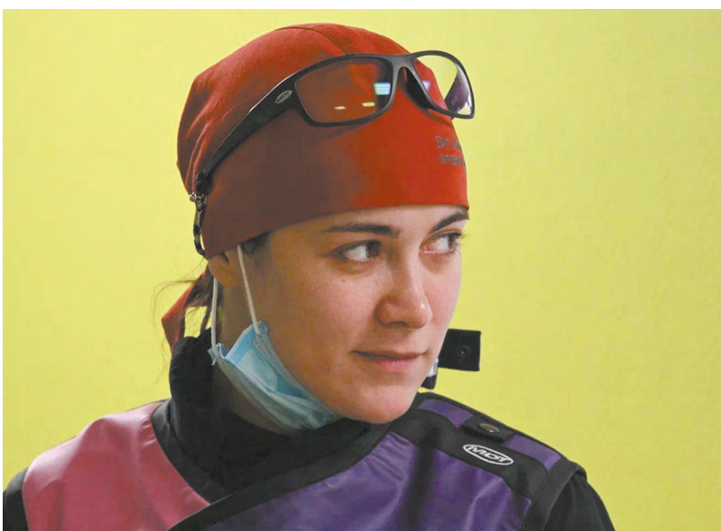
Ее работа — это ювелирная точность под контролем рентгена, без больших разрезов и шрамов

— Помимо знаний и понимания всех процессов, надо чувствовать настроение хирурга. Если оно чем-то омрачено, нужно подбодрить его, сделать все, чтобы в команде не было «плохого дня», — считает она.