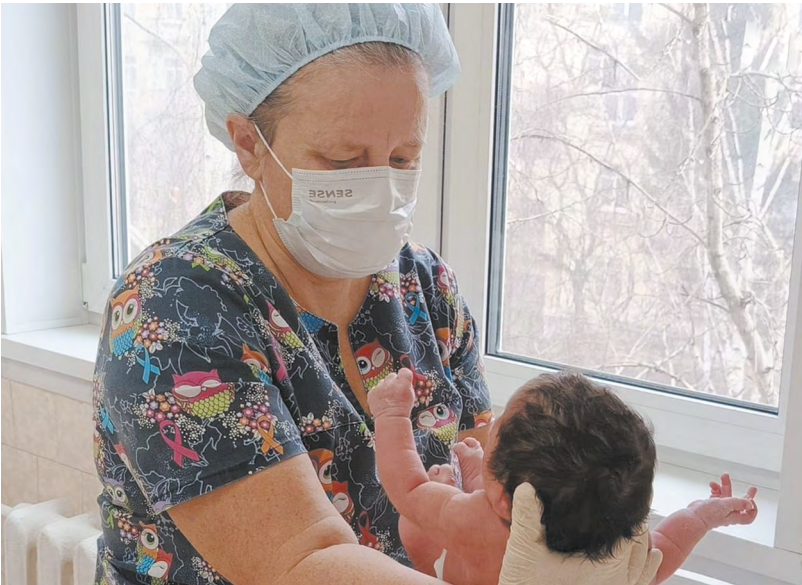
Сотрудников закрытого роддома пригласили в другие медучреждения города

– Наша первоочередная задача – безопасность медицинской помощи. Роддом на Дагестанской этим требованиям не соответствует. И дело даже не в том, что здание 1964 года постройки требует ремонта. А в том, что все ключевые помещения – родовые залы, операционные и реанимация – по современным требованиям должны находиться на одном этаже. Это важно для скорости оказания помощи в экстренных ситуациях. Мы не можем рисковать ни одной женщиной и ни одним ребенком, – пояснила глава минздрава. Она отметила, что все вопросы с трудоустройством персонала улажены, сотрудников ждут в акушерском стационаре на Комвузовской, 3, в других медучреждениях, и они имеют возможность выбирать. При этом министр заверила, что дефицита мест в городских роддомах