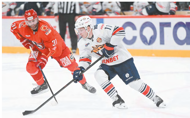
▲ «Автомобилист» сразился с «Металлургом» на ледовой арене в уральской столице