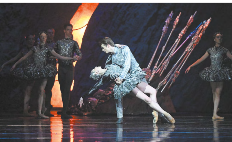
▲ Балет «Каменный цветок» вошел в число номинантов «Золотой Маски»