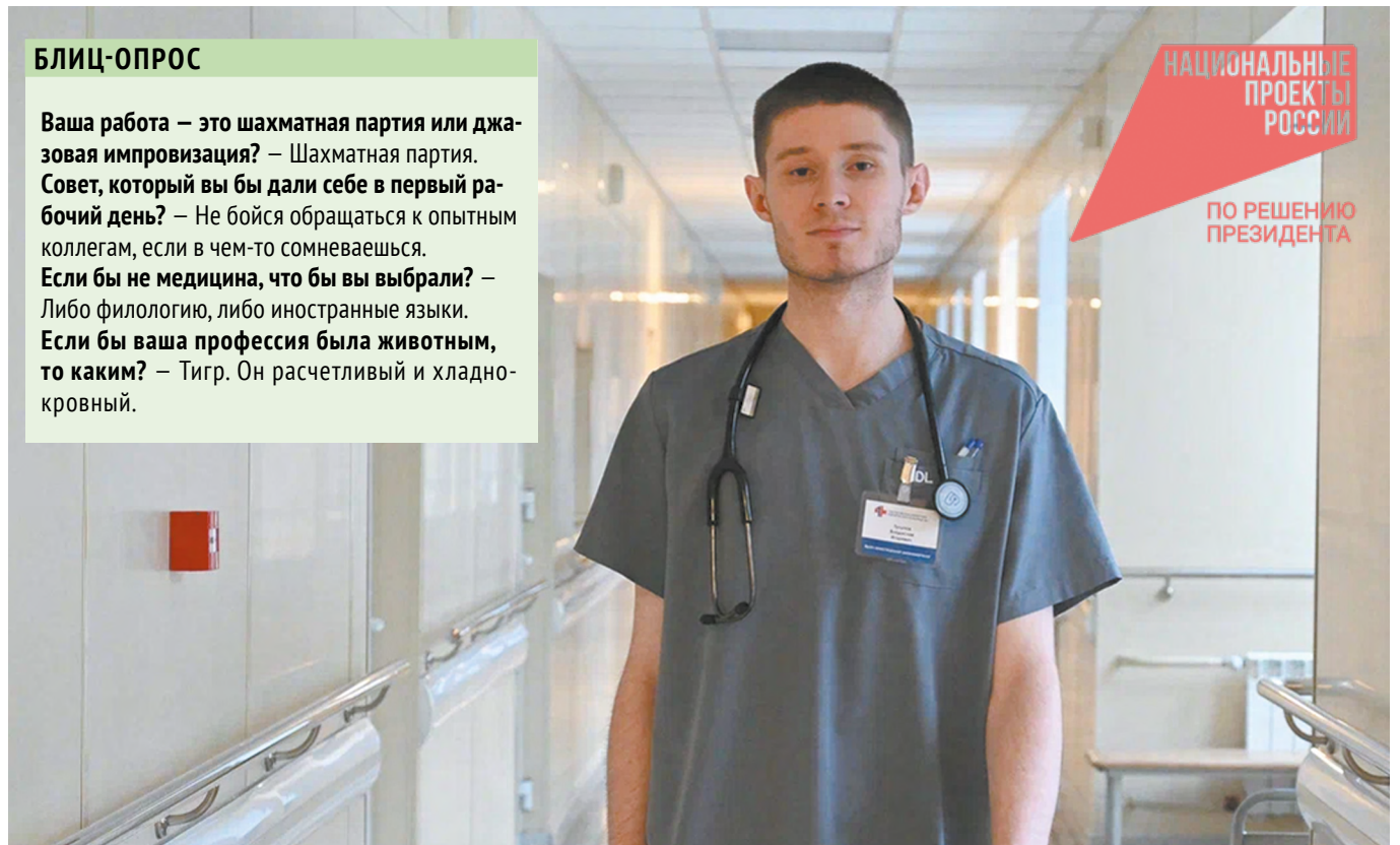
Врач-анестезиолог-реаниматолог защищает пациента от хирургического стресса

Если бы ваша профессия была животным, то каким? — Тигр. Он расчетливый и хладнокровный.