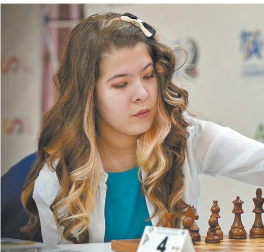
▲ Шах и мат! Королева с Урала забирает главную партию