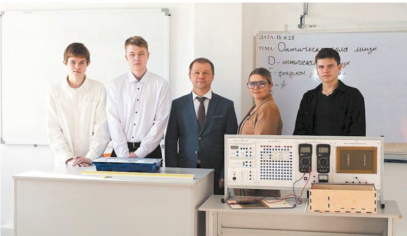
▲ От школьной парты – к большим открытиям. В Покровской школе Каменского района открылся инженерно-технологический класс