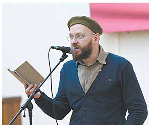
▲ Диалог двух искусств: филармония и областная научная библиотека им. В. Г. Белинского пригласили уральцев на «Свиридовские чтения»