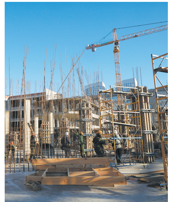
▲ Строительство школы на улице Советской в Екатеринбурге по концессионному соглашению завершится в декабре 2024 года.

▼ Конференция «Владислав Крапивин: философ, писатель, педагог и журналист» собрала ученых и педагогов со всей России.