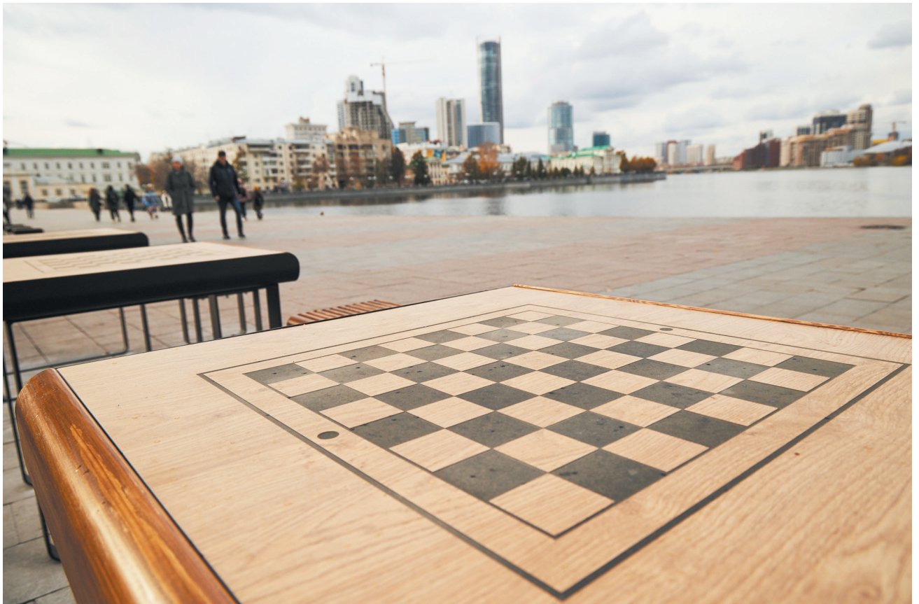
▲ В центре Екатеринбурга установлены шахматные столы и лестница-амфитеатр: объекты созданы на грант, полученный для создания туристического кода уральской столицы.

«Очевидно, что доступность такой инфраструктуры, качество и многообразие спортивных объектов прямо влияют на качество жизни, на здоровье миллионов людей, открывают возможности для занятий физической культурой на постоянной основе, для стимулирования желания людей заниматься спортом, выбирать для себя активный досуг и, главное, здоровый образ жизни в конечном итоге. И конечно, серьезный рост производства отечественных спортивных товаров и оборудования должен быть обеспечен», — сказал глава государства.