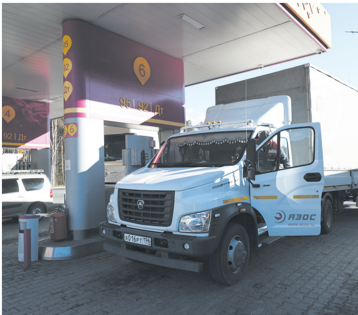
▲ На федеральной автодороге Р242 Пермь — Екатеринбург, которая станет частью скоростного маршрута М-12, прошла проверка объектов дорожной инфраструктуры.