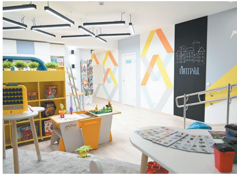
Программно-аппаратный комплекс «Муза» в мобильной библиотеке Дегтярска позволяет создавать мультики и интерактивные книги.

Библиотека становится не просто местом чтения, но и интеллектуальным центром, где можно встречаться, учиться, общаться, обсуждать.