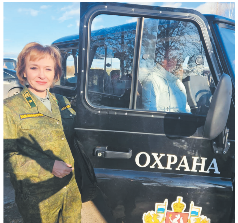
▲ В Верхотурском лесничестве появился УАЗ «Хантер». Это 20-й внедорожник, приобретенный для патрулирования лесов в 2023 году.