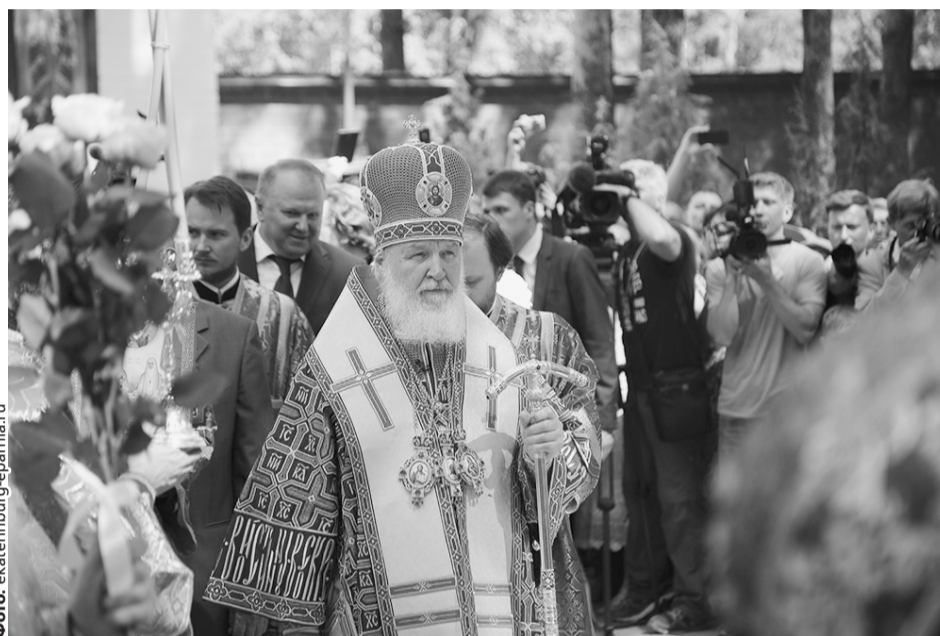
Святейший Патриарх Московский и всея Руси Кирилл во время службы в храме в Алапаевске.

«Я хотел бы от всего сердца пожелать вам и всем жителям Урала успехов в трудах и, что самое главное, – мира душевного. Понятие «счастье» определяется не цифрами экономического развития, хотя они важны, а состоянием человеческой души. Дай Бог, чтобы успехи в экономическом развитии у нас шли рука об руку с гармонизацией внутреннего состояния человеческих душ. Над первым работает светская власть, над духовным – церковная», –