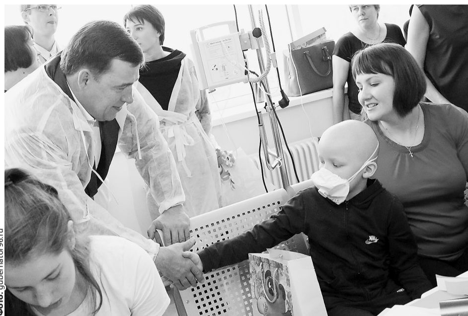
В 2016 году фонд «Подари жизнь» благодаря «Екатерининской ассамблее» помог уральским детям, страдающим онкозаболеваниями.