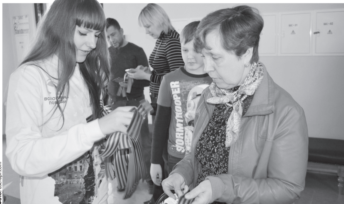
На поддержку и развитие добровольчества и волонтерства в России в 2018 году государство выделило 200 млн рублей.

Актуальность деятельности волонтеров сегодня подтверж-