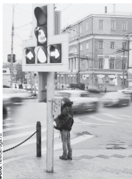
С умными светофорами «пробок» не будет.