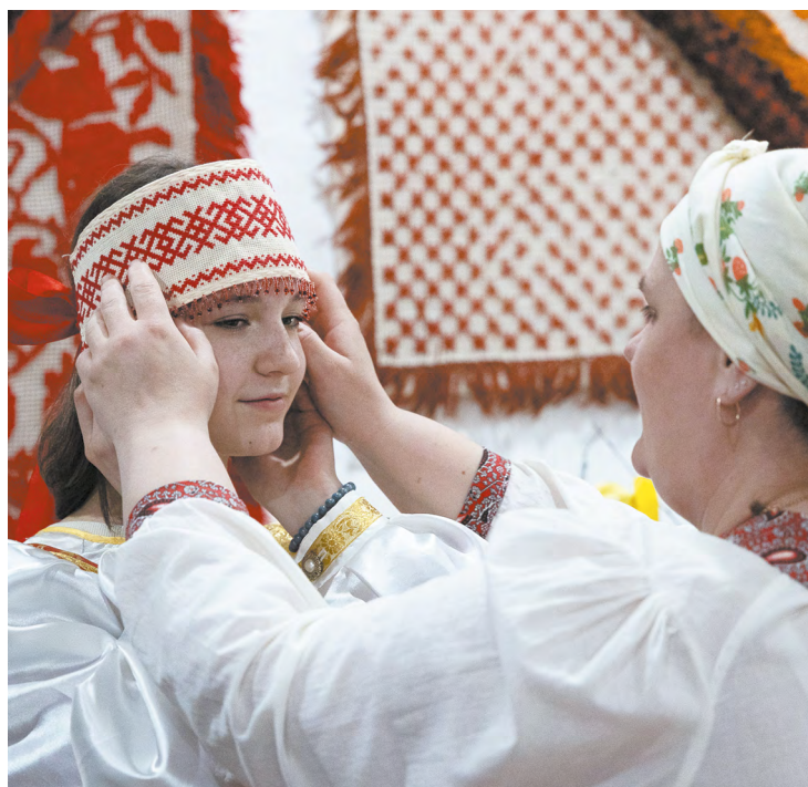
▲ В Свердловской области «Ночь музеев» прошла на 250 площадках.