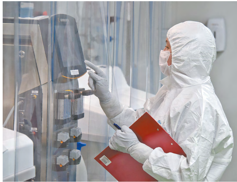
Продукцию новоуральского завода «Медсинтез» на выставке «Россия» высоко оценил министр здравоохранения РФ Михаил Мурашко.

технологии, «зеленая» химия, новые материалы и технологии для самых разных отраслей экономики.