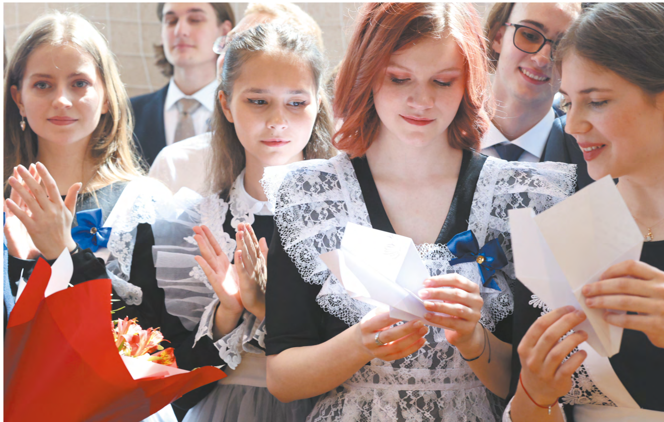
▲ Последний звонок прозвенел для 17 тысяч юных свердловчан. 23 мая у 11-классников начались выпускные экзамены.