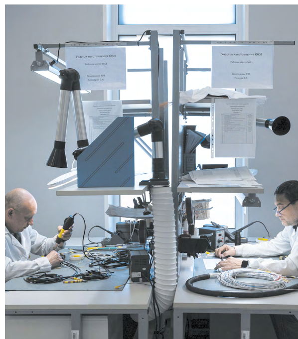
▲ Компания «Эйрбург», производящая беспилотники, запустила новую площадку для выпуска комплектующих. Фото: Елена Ельцова

▼ На старт «Майской прогулки» в Екатеринбурге вышло рекордное количество участников — 13 008 человек. Фото: Елена Ельцова