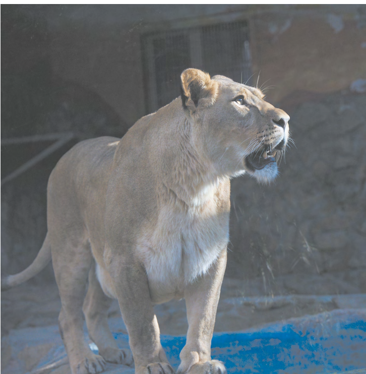
▲ Екатеринбургский зоопарк отпраздновал 94-летие.