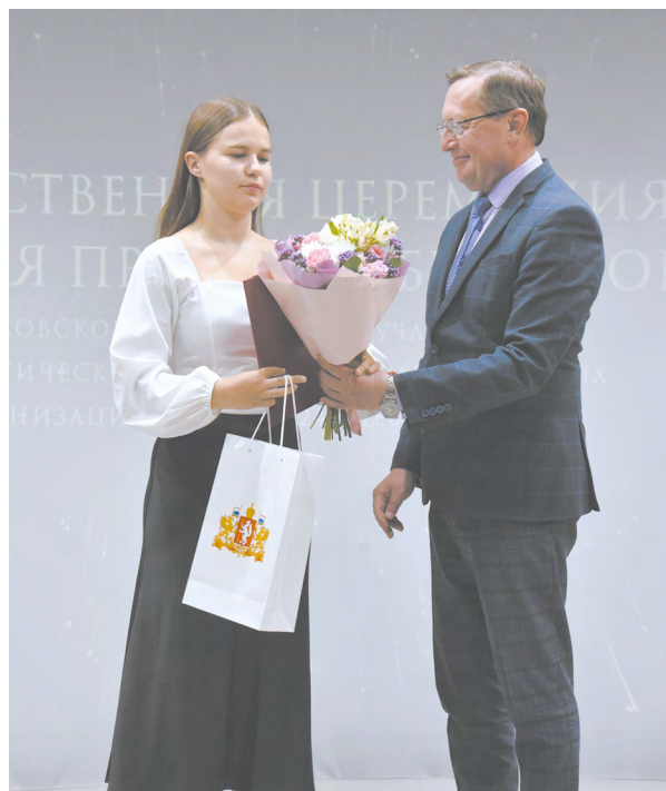
▲ На Среднем Урале по поручению губернатора наградили лучших школьников и их педагогов.