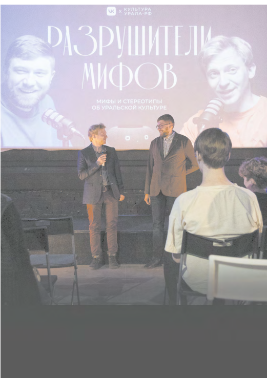
▼ Уральские краеведы запустили видеоподкаст «Разрушители мифов».