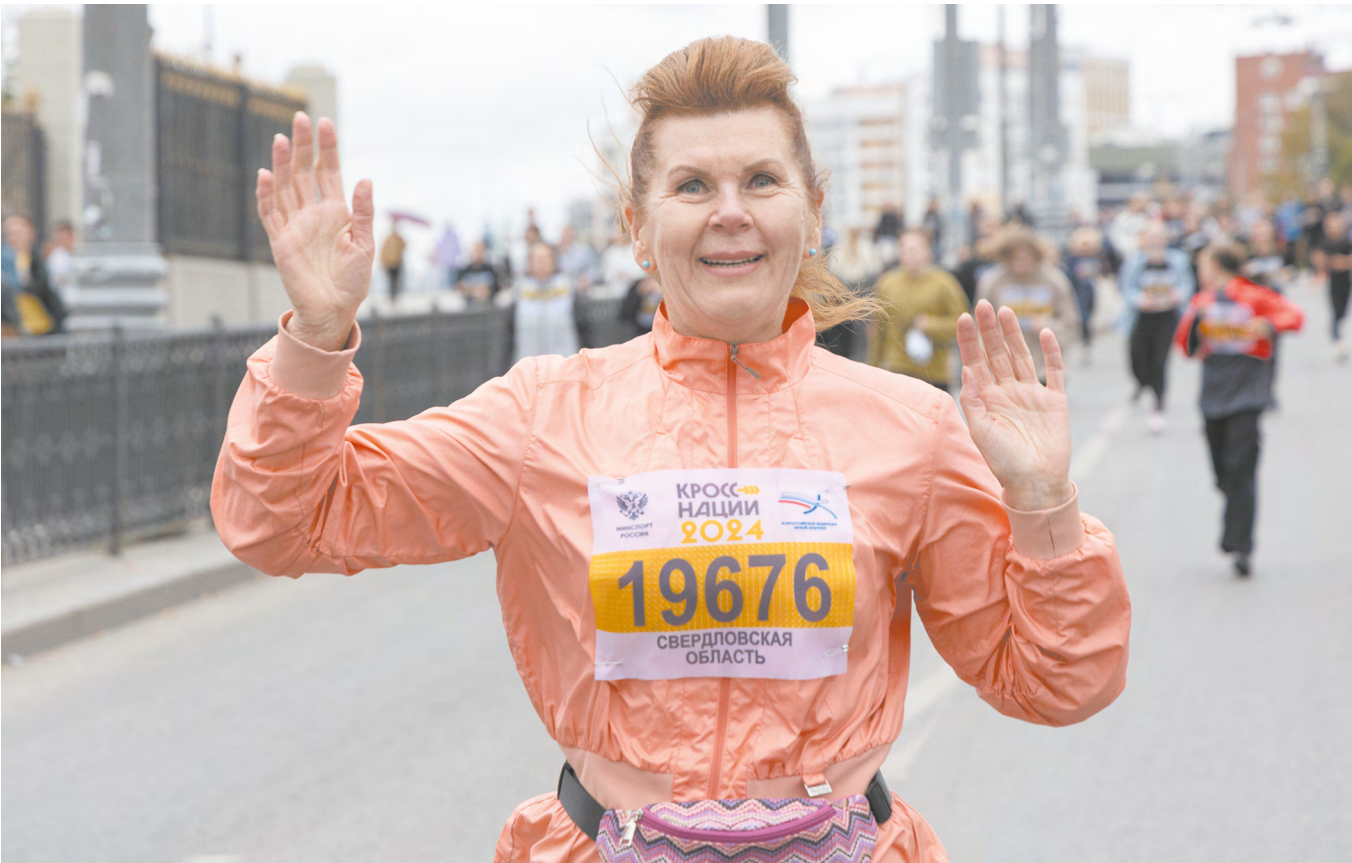
▲ Юбилейный «Кросс нации» собрал более 21 тысячи человек в Екатеринбурге.