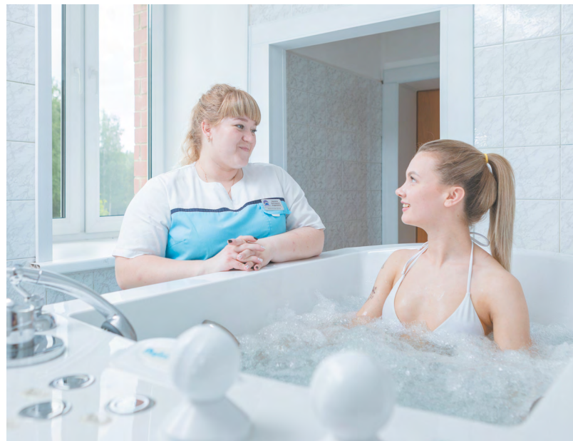
В свердловском санатории «Липовка» этим летом завершили ремонт ванного отделения и установили новое оборудование.

минерально-сырьевых регионов России. По ее словам, появление ассоциации курортов будет содействовать развитию всей отрасли страны.