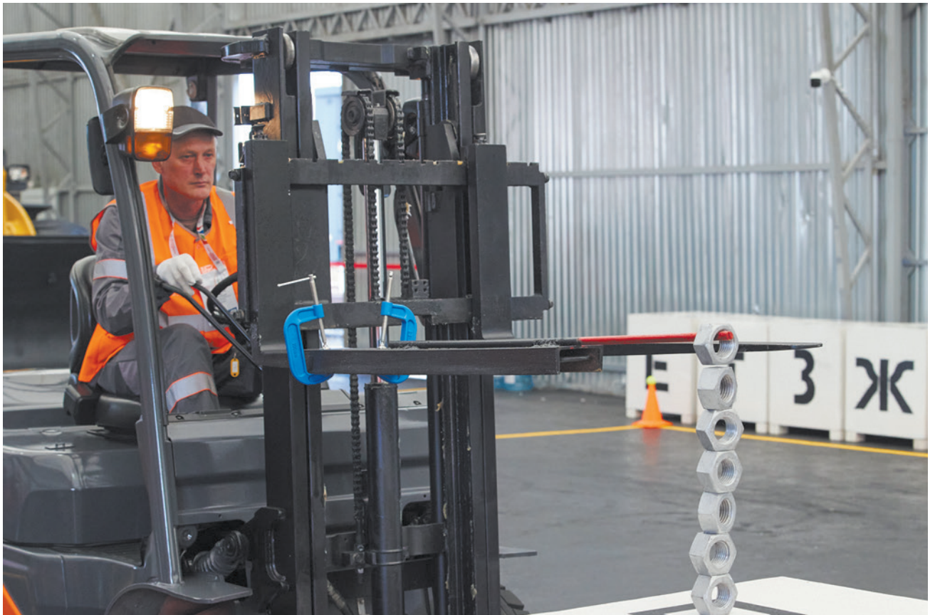
▲ В чемпионате профессионалов РЖД приняли участие более двух тысяч человек — представители 65 железнодорожных профессий.

«Кванториум» расположен в парке культуры и отдыха, где он привлекает внимание посетителей, может заинтересовать. Эффект профориентации колоссальный», — сказал Евгений Куйвашев. «На самом деле сейчас такая задача и стоит: чтобы специалисты, приходя, не слышали: „Вы пришли, забудьте всему, что вас учили“, а, наоборот, слышали: „Вы пришли, вы учились, сейчас мы у вас будем учиться“, — подчеркнул Олег Белозеров.