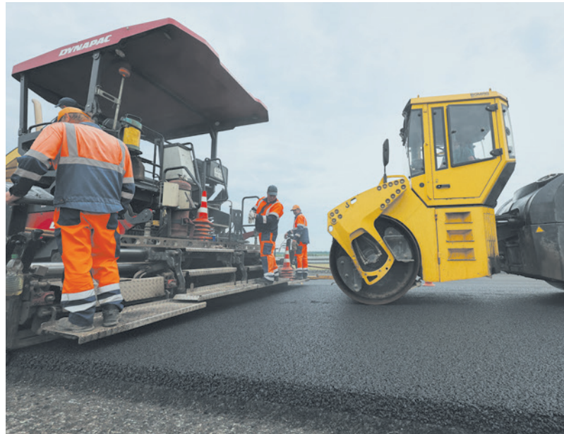
В дорожном строительстве существует единая трехэтапная система контроля качества ремонта.