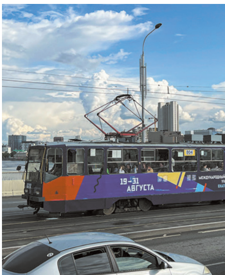
▼ Общественный транспорт в цветах Международного фестиваля университетского спорта запущен в Екатеринбурге.