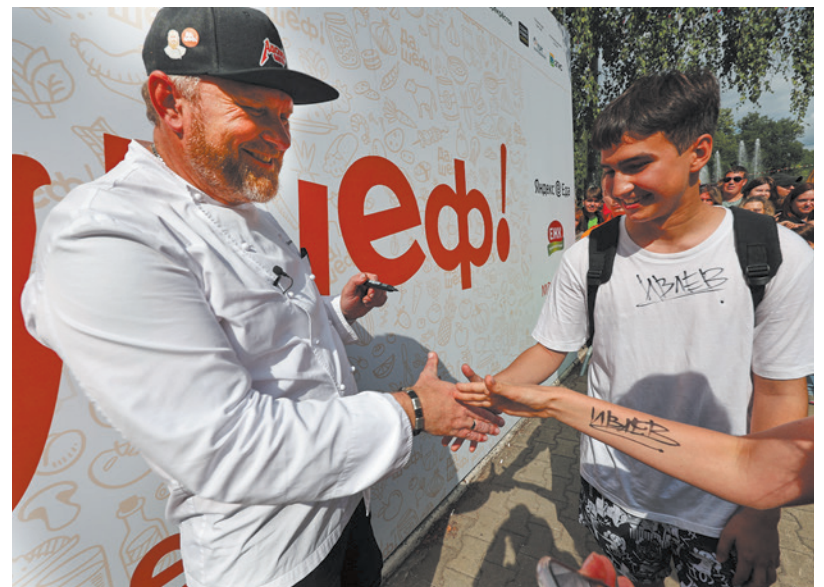
▲ На фестивале «Да, шеф!», посвященном 300-летию Екатеринбурга, шеф-повар Константин Ивлев приготовил самый большой в России рулет с ветчиной.