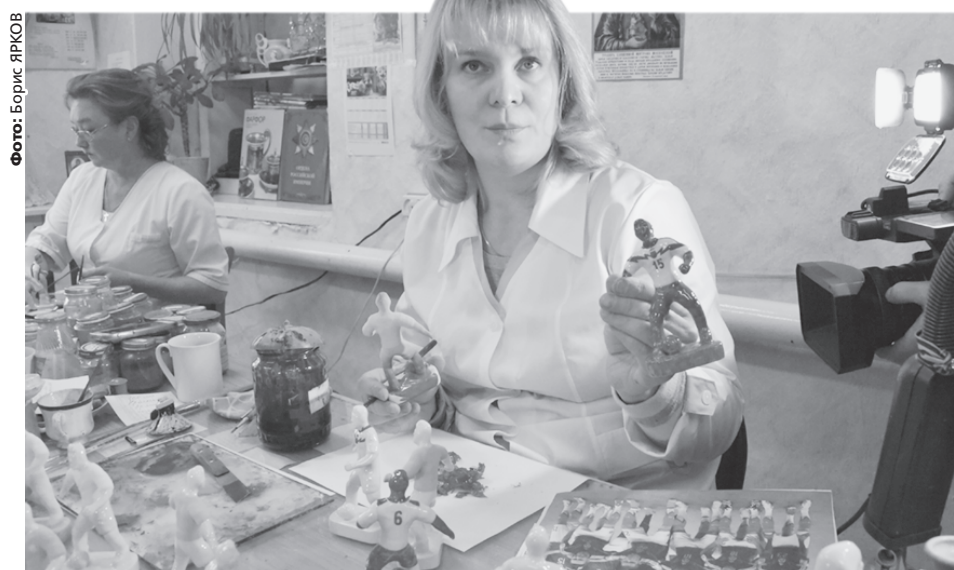
По словам работниц предприятия, фигурка футболиста собирается из семи частей. Сложнее всего изготавливать руки игроков.

Сувениры будут продавать в фирменных магазинах завода и через торговых партнеров. Так, в магазине при заводе одного футболиста уже оцени-