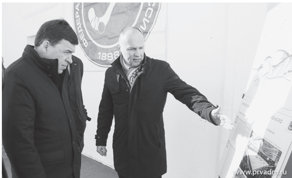
В ходе своего визита в Первоуральск губернатор посетил стадион «Уральский трубник», где были представлены эскизы проекта крытого стадиона с искусственным льдом.