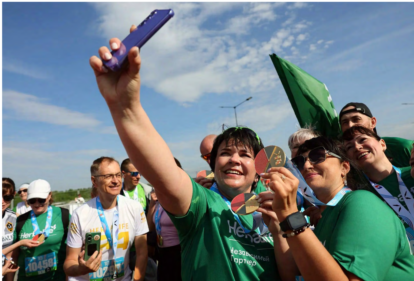
▲ Первая беговая эстафета стартовала по Большой уральской тропе. Длина маршрута составляет 2300 километров