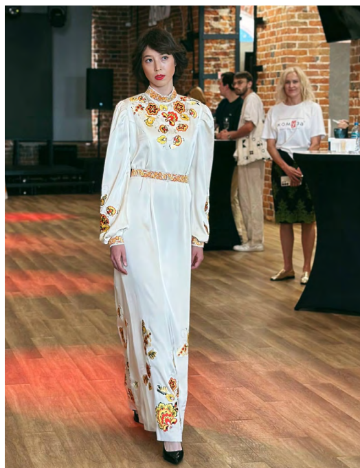
▲ Бизнес как искусство: в «Домне» открылась выставка «Бизнес в объективе. Креативные индустрии». Героями выставки стали 15 предпринимателей