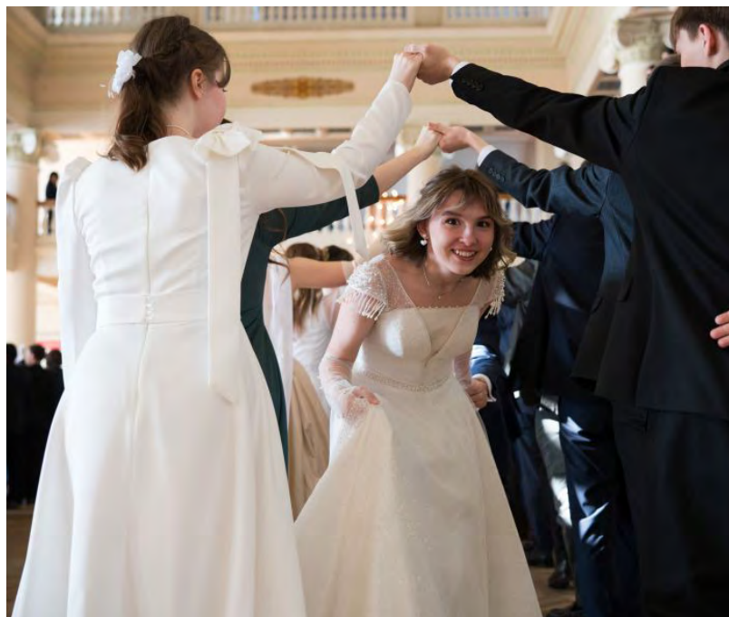
▲ Блеск, грация и дипломатия. В УрФУ прошел II Дипломатический русский бал в честь юбилея департамента международных отношений