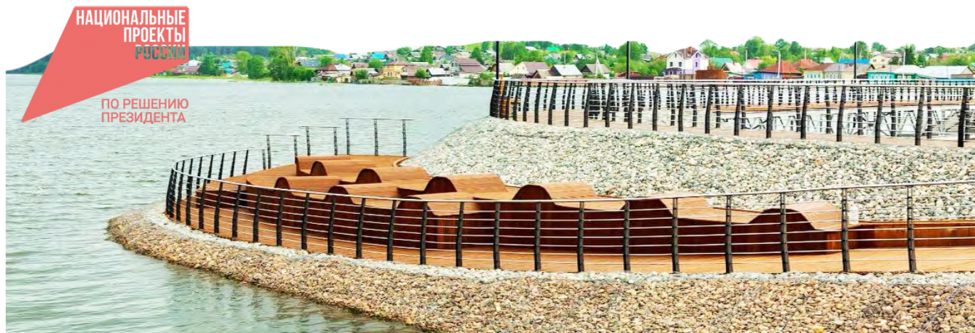
Красота природная может быть органично дополнена красотой рукотворной. Было бы желание!

В 2023 году был завершен проект благоустройства набережной Верхнетуринского