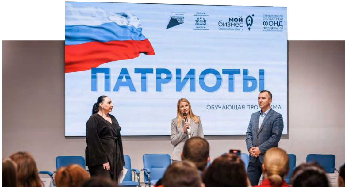
Региональные меры поддержки для вчерашних участников спецоперации направлены на их вовлечение в повседневную жизнь и комфортную социализацию