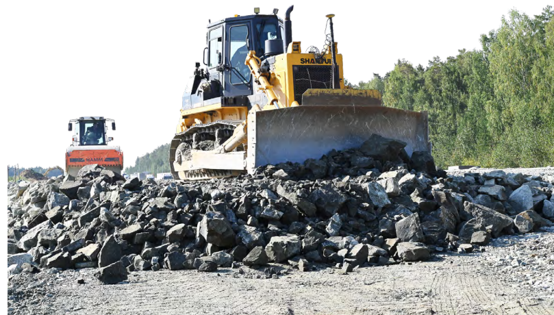
Колоссальный объем работ выполняется для того, чтобы расширить Екатеринбургскую кольцевую автодорогу

По словам Дениса Паслера, строители последовательно приводят к единому современному стандарту важную дорожную артерию региона. После реконструкции значительно повысится пропускная способность северного полукольца и безопасность дорожного движения. Также улучшится транспортная связанность Екатеринбургской агломерации.