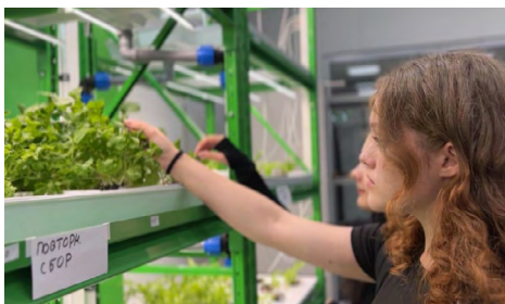
Фото Екатеринбургского центра занятости Сост. Лариса Исламова

#Трудоустройство В этом году запланировано трудоустроить около 15 тысяч школьников с помощью центров занятости, на эти цели выделят более 60 миллионов рублей. Средний размер зарплаты подростков в прошлом году составил более 9 тысяч рублей. Несовершеннолетние, трудоустроенные через ЦЗ, будут получать дополнительную выплату от региона в размере 4 284 рубля в месяц. Работу для подростков предлагают более 200 работодателей. Среди наиболее востребованных – подсобные работы, благоустройство и озеленение территорий. Найти вакансию можно через портал «Работа в России» или лично в любом центре занятости региона.