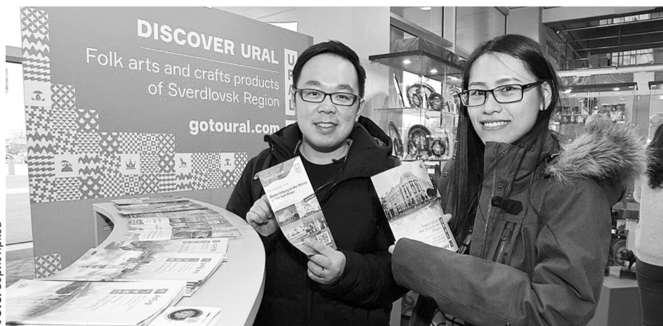
Для гостей города подготовлены карты, буклеты и путеводители

«В Свердловской области развивается сеть туристско-информационных служб, сегодня в регионе их 11, еще 5 действуют в других областях. Доступная, качественная информация способствует формированию интереса к региону. И каждый турист, который бывает в нашей области,