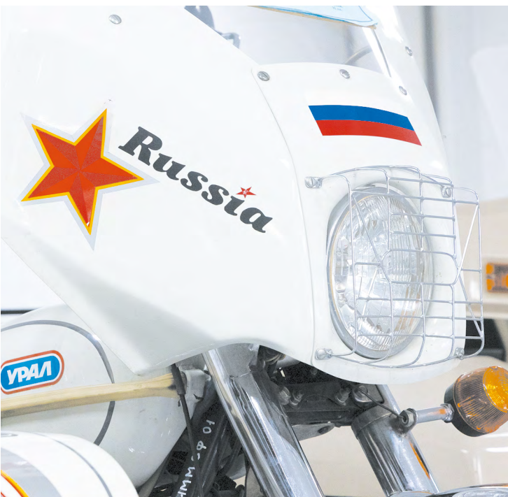
▲ Выставка ретромотоциклов и конкурс на самую мотоциклетную семью прошли в рамках «Мото-Феста» в Ирбите.