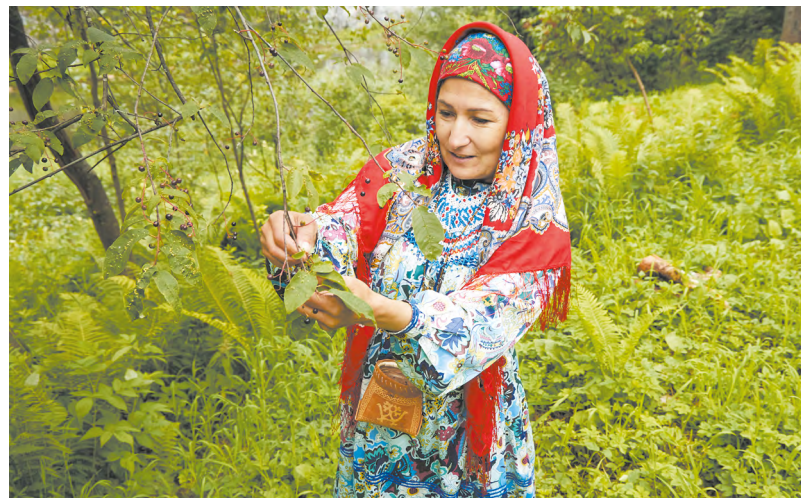
Экологическая повестка перестала быть чем-то обособленным и теперь является частью большинства сфер жизни.

Как отметил Денис Мамонтов, новое сотрудничество позволит дополнительно изу-