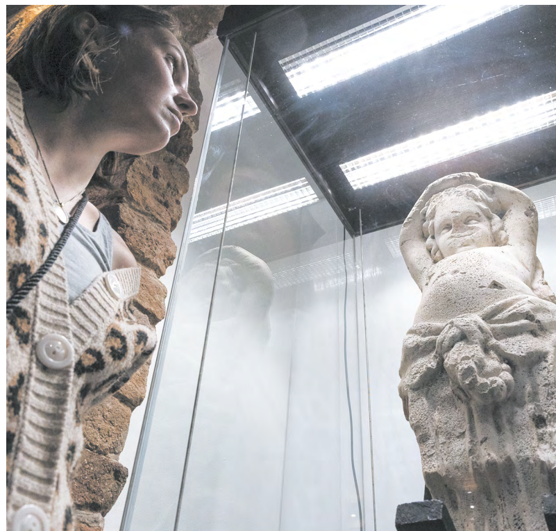
▲ В Музее истории Екатеринбурга открылась выставка «Растущий организм. Город как конструктор».