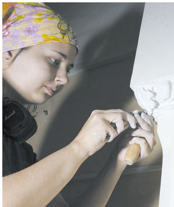
▲ В Свердловской филармонии в преддверии нового сезона реставрируют лепнину. Фото: Елена Ельцова

▼ На Кубке России по плаванию золото, серебро и бронзу завоевал 19-летний Савелий Лузин из Новоуральска. Фото: Елена Ельцова