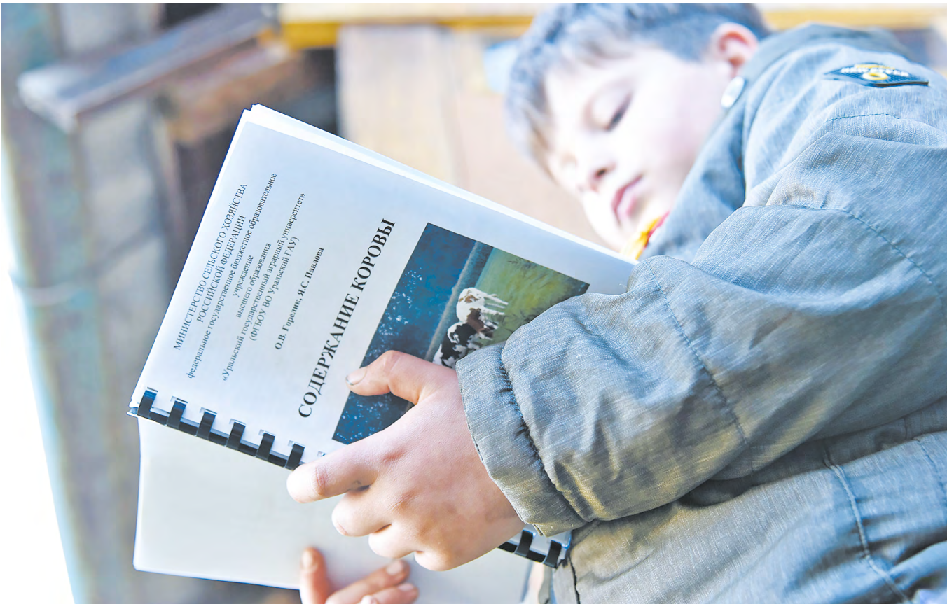
▲ Образовательная программа «Школа фермера» в Свердловской области объявила набор слушателей на пятый сезон.