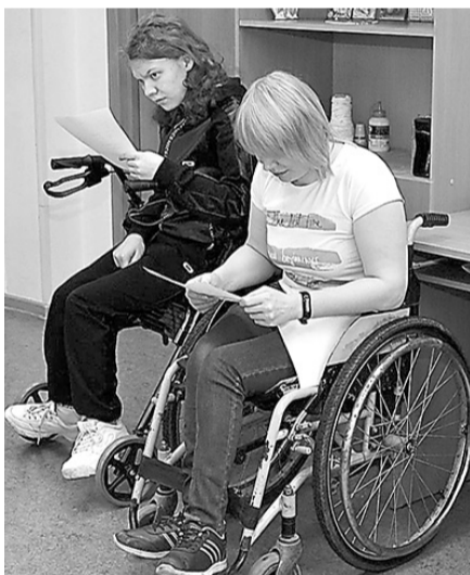
Приложение «Тренер в кармане» сделает жизнь активнее

Напомним, на Среднем Урале на реализацию программы «Доступная среда» из областного бюджета уже направлен почти 1 миллиард рублей. Кроме этого, для людей с ограниченными возможностями, желающими путешествовать, в регионе утверждена программа «Инклюзивный туризм в Свердловской области на период 2018-2021 годы».