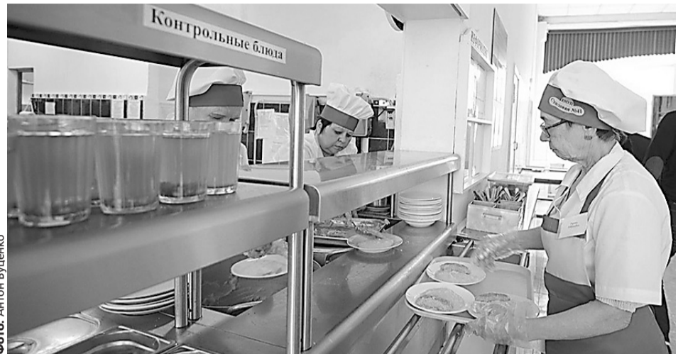
Из областного бюджета на организацию питания в школах выделено более трех миллиардов рублей.