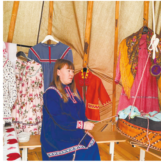
▲ Мансийский чум с предметами быта коренного малочисленного народа Северного Урала появился у школы в поселке Полуночное Фото сверф