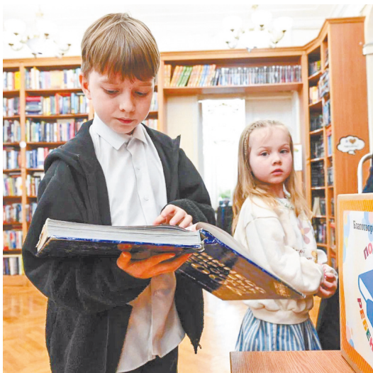
▲ Книжная осень: в регионе прошел масштабный «День чтения»