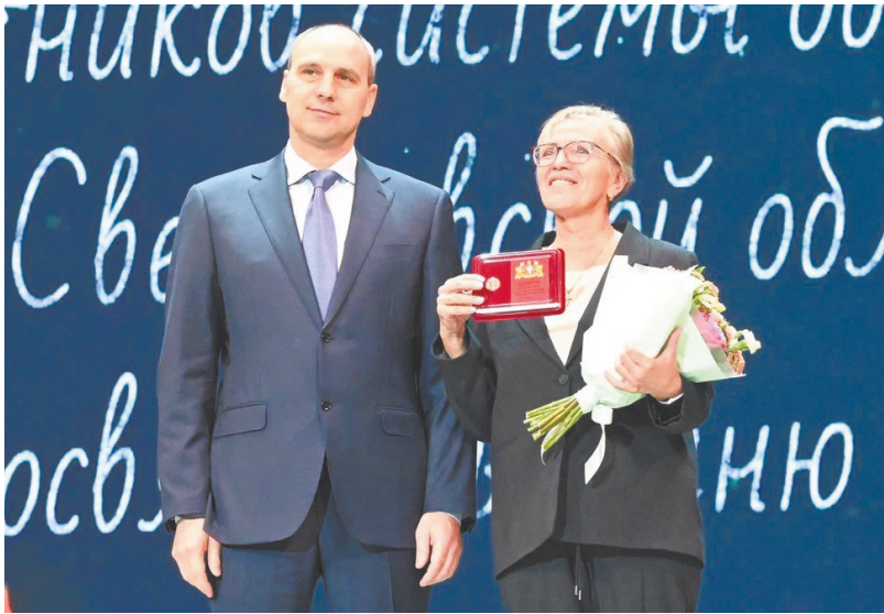
▲ В Академическом театре музыкальной комедии уральской столицы 6 октября собрались лучшие представители педагогического сообщества Среднего Урала