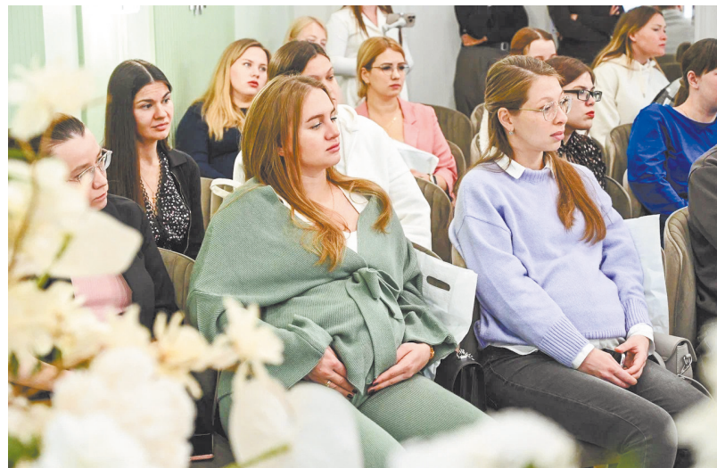
▲ Праздник для будущих мам устроили в екатеринбургском Дворце бракосочетания