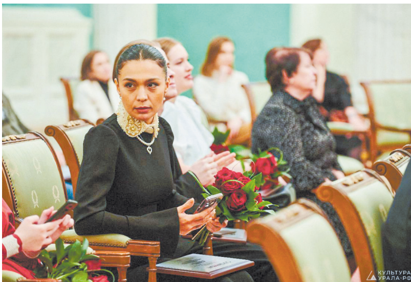
▲ Уральские музыканты-педагоги вошли в число лучших в стране