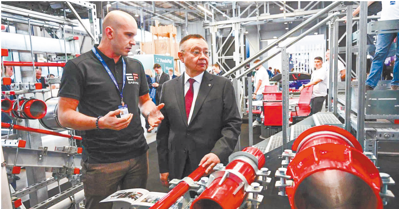
▲ Будущее строительства: в Екатеринбурге прошел форум 100+ TechnoBuild