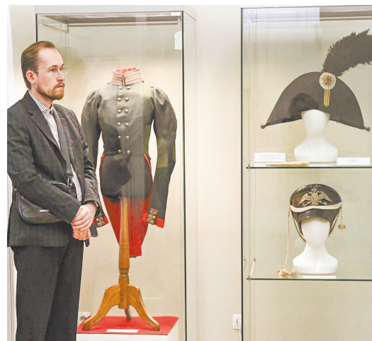
▲ Выставка «Император Александр I и Отечественная война 1812 года» открылась в уральской столице