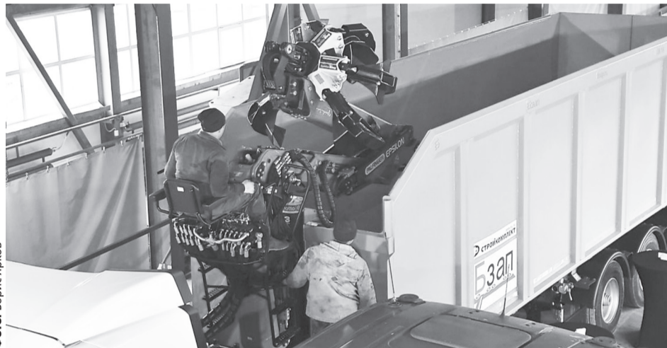
Кроме Красноуфимска и Екатеринбурга строительство мусоросортировочных заводов в 2020 году с высокой долей вероятности начнется в Нижнем Тагиле, Первоуральске и Краснотурьинске

«Ответственно заявляю: ни один из двенадцати мусоросортировочных заводов не будет строиться без согласия