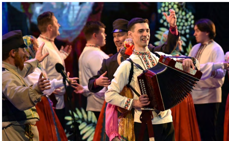
▲ После 40-летнего перерыва Уральский хор снова выступил в столице Туркменистана