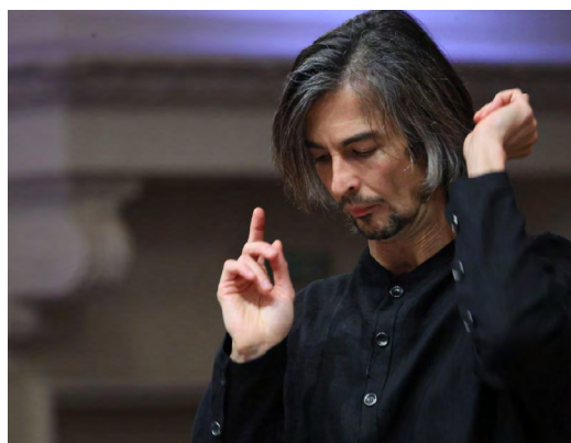
▲ Екатеринбург познакомился с новым главным дирижером Государственного академического симфонического оркестра России имени Е. Ф. Светланова – Филиппом Чижевским