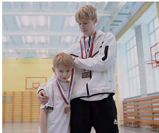
▲ Как изменить мир за 60 секунд? Стартовал прием заявок на участие в XVI Международном фестивале социальной рекламы «Выбери жизнь»