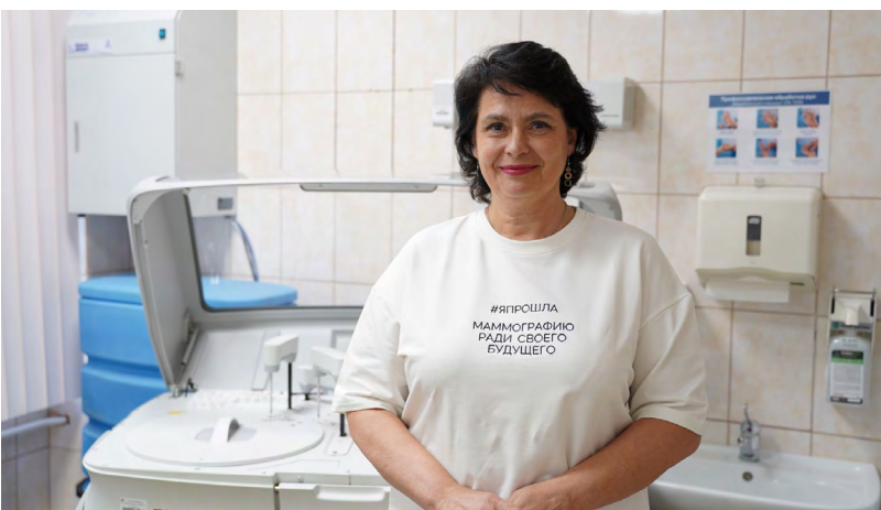
▲ Флешмоб в поддержку своевременной диагностики рака груди стартовал в Свердловской области по инициативе минздрава