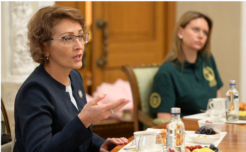
На встрече с губернатором жены и матери бойцов СВО поделились, что сталкиваются с бюрократическими проволочками при получении обещанных мер поддержки

ЧТО ВСЕГО НУЖНЕЕ? Наиболее востребованными мерами социальной поддержки участников спецоперации и членов их семей в регионе являются предоставление денежных выплат, содействие в трудоустройстве, организация медпомощи и реабилитации, обеспечение детей бойцов бесплатным горячим питанием в школах, одеждой и обувью, а также социальная выплата на приобретение земельного участка.