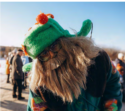
▲ Сказочные гости из восьми российских регионов прибыли в Свердловскую область на «День рождения Урал Мороза»