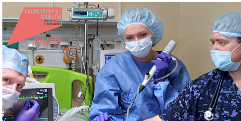
Напряженная история спасения малыша потребовала слаженных усилий врачей нескольких медицинских организаций

Крайне тяжелое состояние малыша потребовало применения передовой ме-