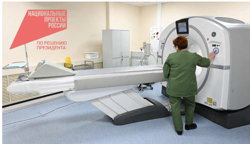
Около 71 млн руб. было затрачено на ремонт и подготовку амбулатории в Таежном, а также приобретение компьютерного томографа с его установкой

Для расширения спектра медицинских услуг идет плановая реконструкция – обновлена кровля, почти везде стоят пласти-