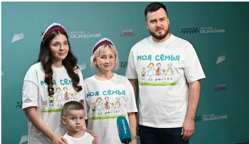
▲ Восемь свердловских семей вышли в финал всероссийского конкурса «Это у нас семейное»