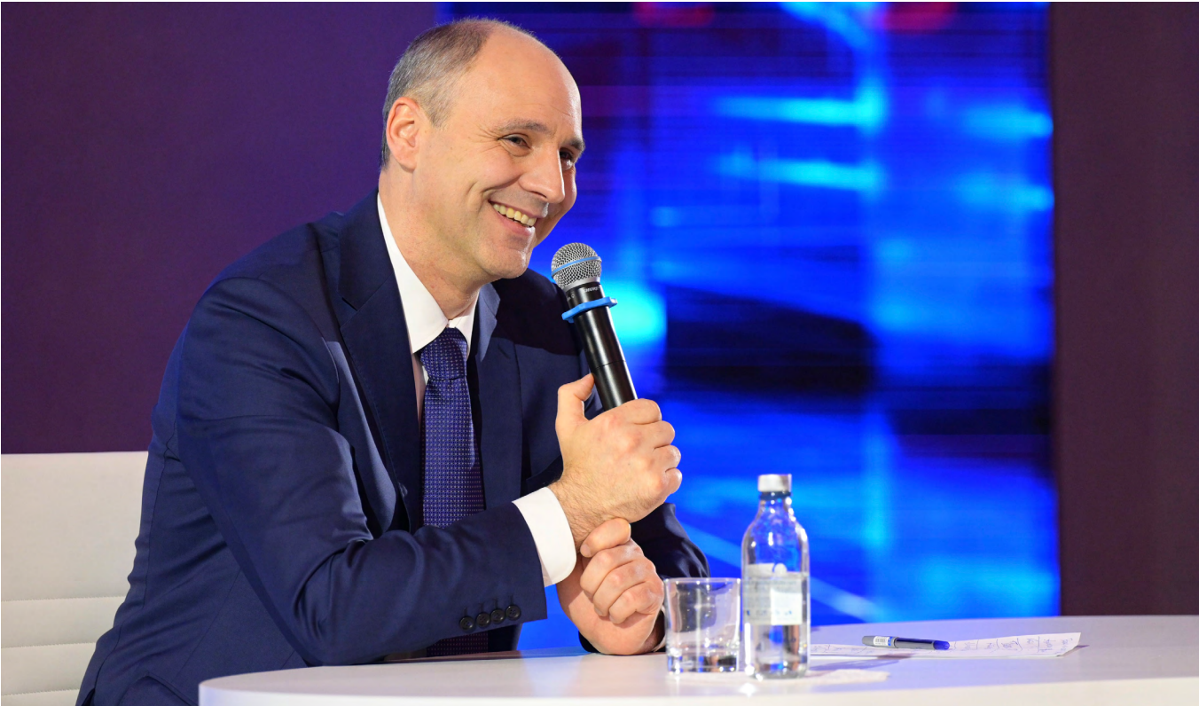
▲ Губернатор Свердловской области Денис Паслер провел большую прямую линию, во время которой ответил на вопросы жителей региона