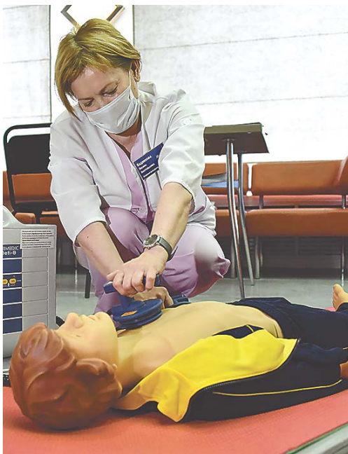
▲ Во время акции «Оберегая сердца» 250 сотрудников «НПО автоматика» узнали, как отличить инфаркт от инсульта, и получили консультации кардиолога.