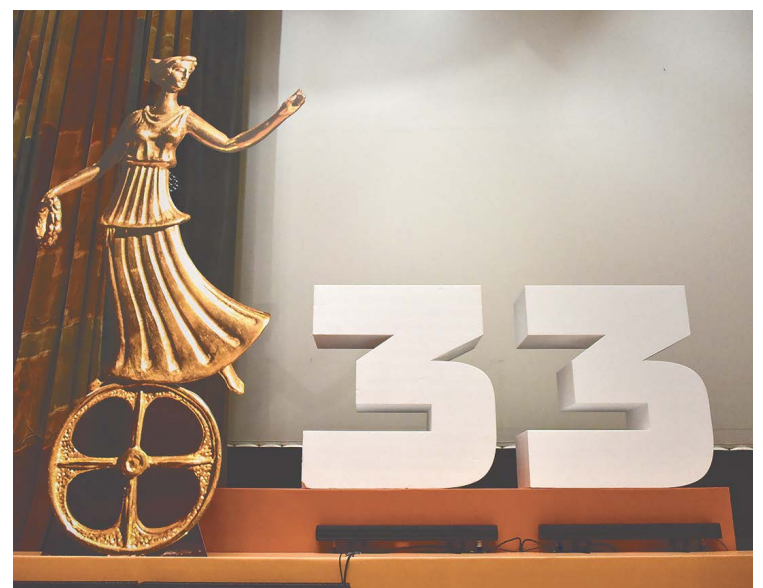
▲ XXXIII международный фестиваль документального кино «Россия» проходит в Свердловской области.