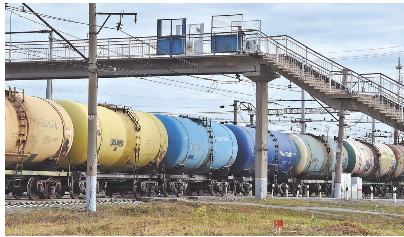
Свердловская железная дорога обеспечивает 11 процентов погрузки всех железных дорог России

кательным, нам нужны не только традиционные форматы работы, но и новые проекты. Такой проект — это «Сухой порт». У Свердловской области есть уникальный шанс — стать новым логистическим хабом России, воротами на Восток, — отметил губернатор Куйвашев.