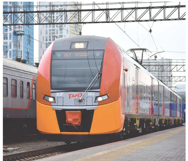
▲ Более 13 тысяч жителей области воспользовались пригородными поездами, предназначенными специально для туристов с апреля по сентябрь.