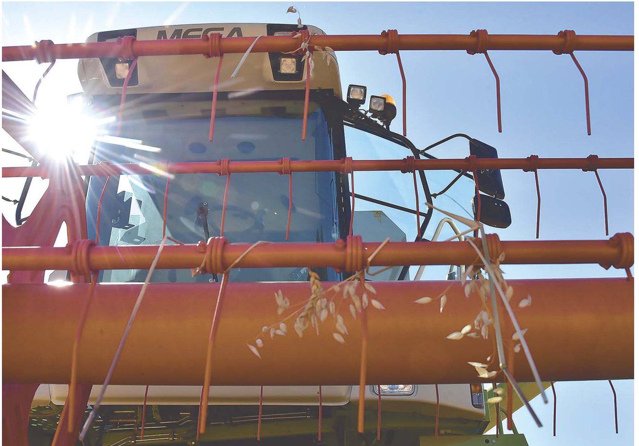
▲ В Свердловской области урожай зерновых в полтора раза превысил показатель 2021 года. Собрано уже почти 900 тысяч тонн зерна при плане в 687 тысяч тонн.