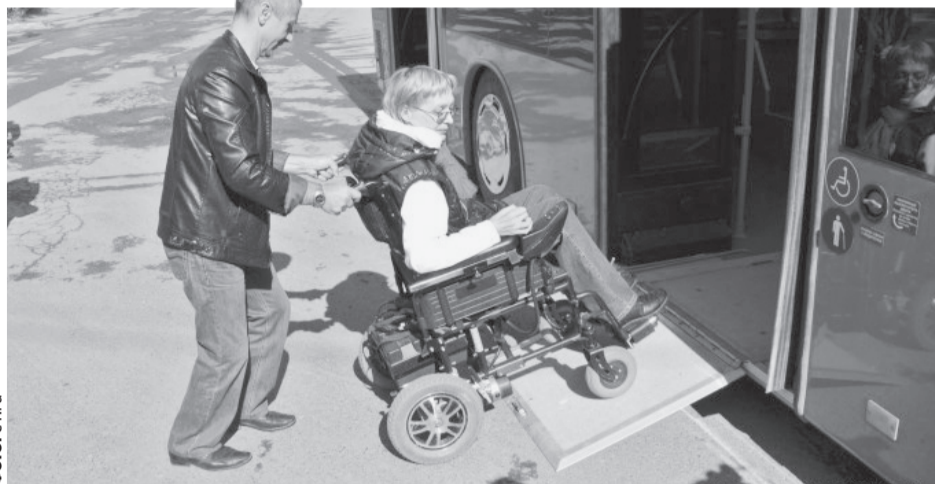
При закупках автотранспорта приоритет отдается низкопольным моделям.

В филиале №2 Фонда социального страхования «УР» сообщили, что «обеспечение осуществляется организациями-поставщиками в соответствии с рекомендациями индивидуальной программы реабилитации и абилитации инвалида в рамках заключенных государственных контрактов за счет средств федерального бюджета». Поскольку на момент подачи пенсионером заявления госконтракты 2017 года были исполнены, ему было выдано уведомление о постановке на учет. Как рассказала «УР» начальник ОСП филиала №2 Людмила Никитина, новый госконтракт на