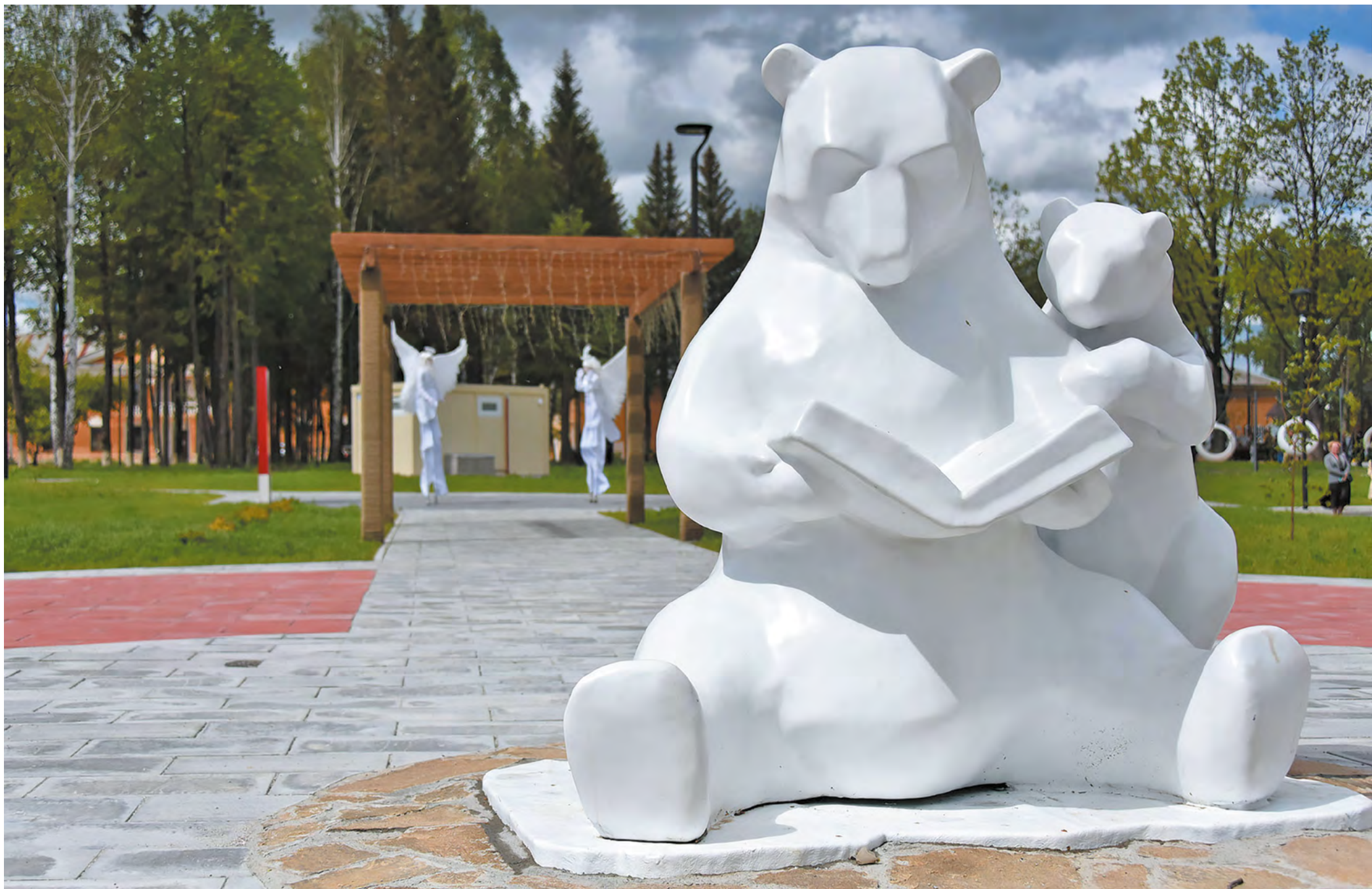
«Набережная огней» в Верхнем Тагиле, благоустроенная в 2022 году