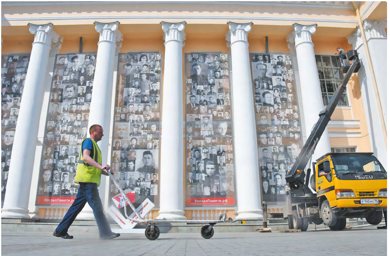
▲ Проект «Вокзал памяти» — это фотографии 850 уральцев, ушедших на фронт со свердловского вокзала, напечатанные на 12 полотнищах, каждое высотой 10 метров.