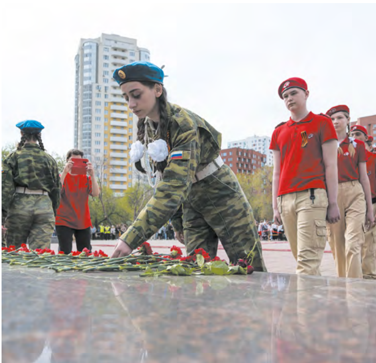
▲ Церемония возложения цветов к памятнику «Седой Урал» прошла в Екатеринбурге.