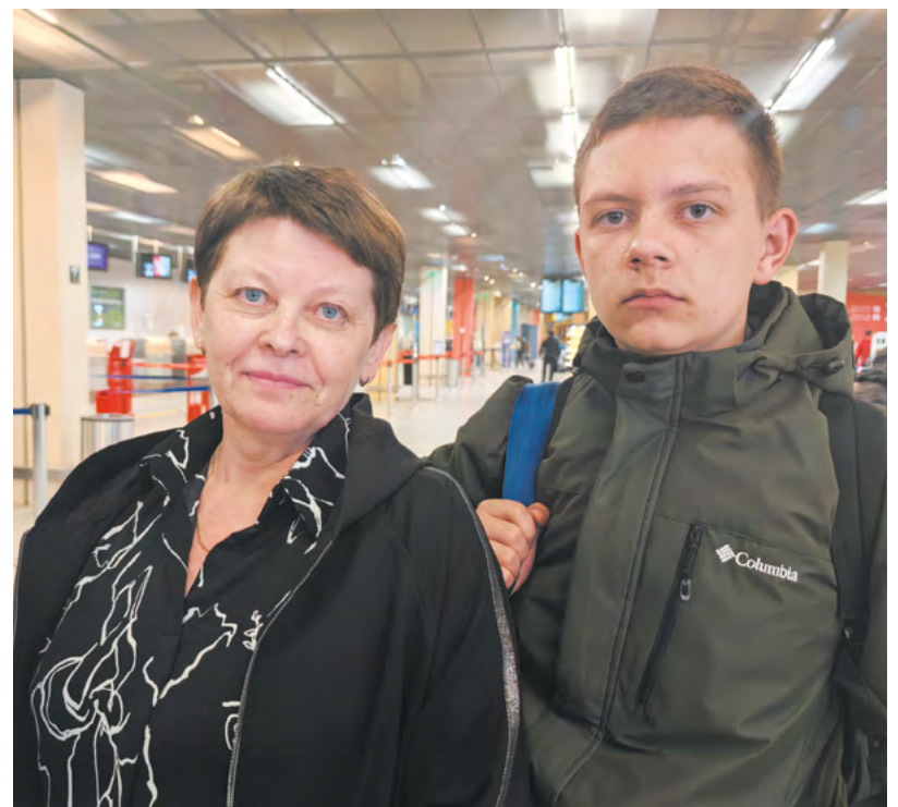
▲ Дети из семей погорельцев отправились на оздоровительный отдых и восстановительное лечение.