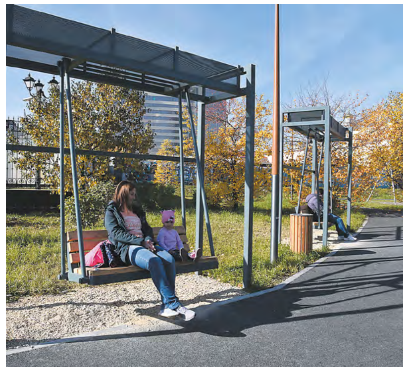
Благоустроенный участок набережной Исети в Екатеринбурге.

уже выбрали проекты благоустройства для своих городов