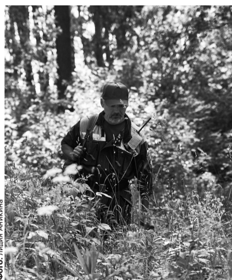
Висимский заповедник создан для сохранения и изучения типичных и уникальных экосистем южно-таежного Среднеуральского низкогорья. На его территории ведутся исследования как научными сотрудниками заповедника, так и специалистами многих научно-исследовательских организаций.

За жизнью животных можно наблюдать, просматривая записи, сделанные с помощью видеоловушек. Так, сотрудники заповедника обратили внимание, что бурые медведи почему-то приходят почесаться к одной и той же ели. «Чесальная» ель — основной способ