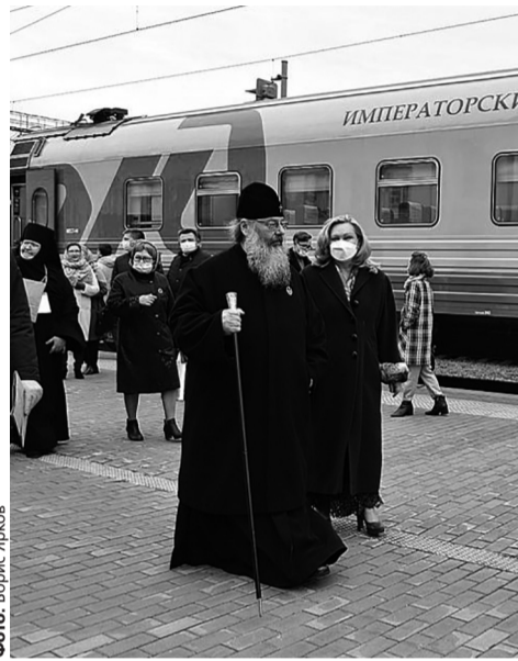
Митрополит Екатеринбургский и Верхотурский Кирилл выразил надежду, что в перспективе такие вагоны появятся и на других направлениях

В вагоне 44 места для сидения, которые покрыты чехлами из красной ткани с вышитым логотипом «Императорский маршрут». На откидных столиках размещена карта-схема маршрута, что позволяет пассажирам знакомиться с объектами показа на территории Свердловской области. В торце вагона