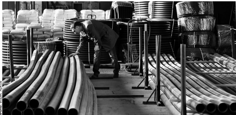
В этом году свою продукцию на мировой рынок поставили 237 региональных компаний на общую сумму 19 миллионов долларов

Эксперты, аналитики внешних рынков уже не раз отмечали, что пандемия – это, конечно, серьезное испытание для экономики, но, как и любой кризис, это еще и время новых возможностей. Россия, которая, в первую очередь, – это экспортер газа, нефти, металлургической и химической продукции, в эти полгода начала менять структуру экспорта. В частности, в 2,7 раза увеличи-