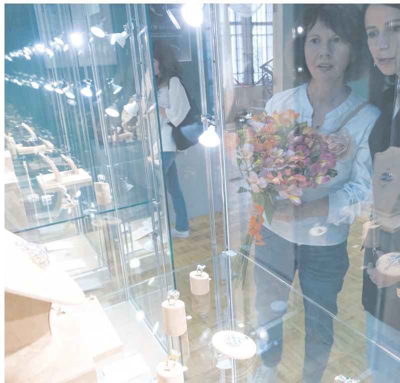
▲ «Дочь своего отца» Татьяны Пинчук-Кисельниковой – вернисаж из цикла выставок в рамках Года семьи.