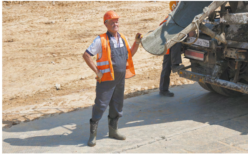
Строительство — важный сегмент экономики, поскольку обеспечивает стабильный спрос на материалы и оборудование, стимулирует развитие производств.

«Механизм комплексного развития территорий уже показал свою эффективность за два года его применения в Свердловской