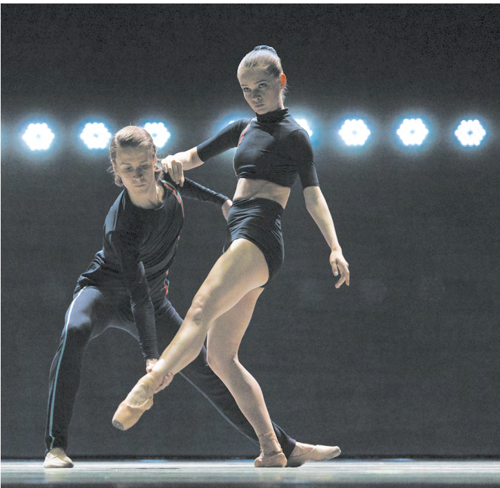
▲ «Урал Опера Балет» представляет двойную премьеру – «Графит» Антона Пимонова и «Птицы» Игоря Булыцына. Фото: Елена Ельцова

▼ В Екатеринбурге состоялся международный турнир по боям на голых кулаках. Фото: Елена Ельцова