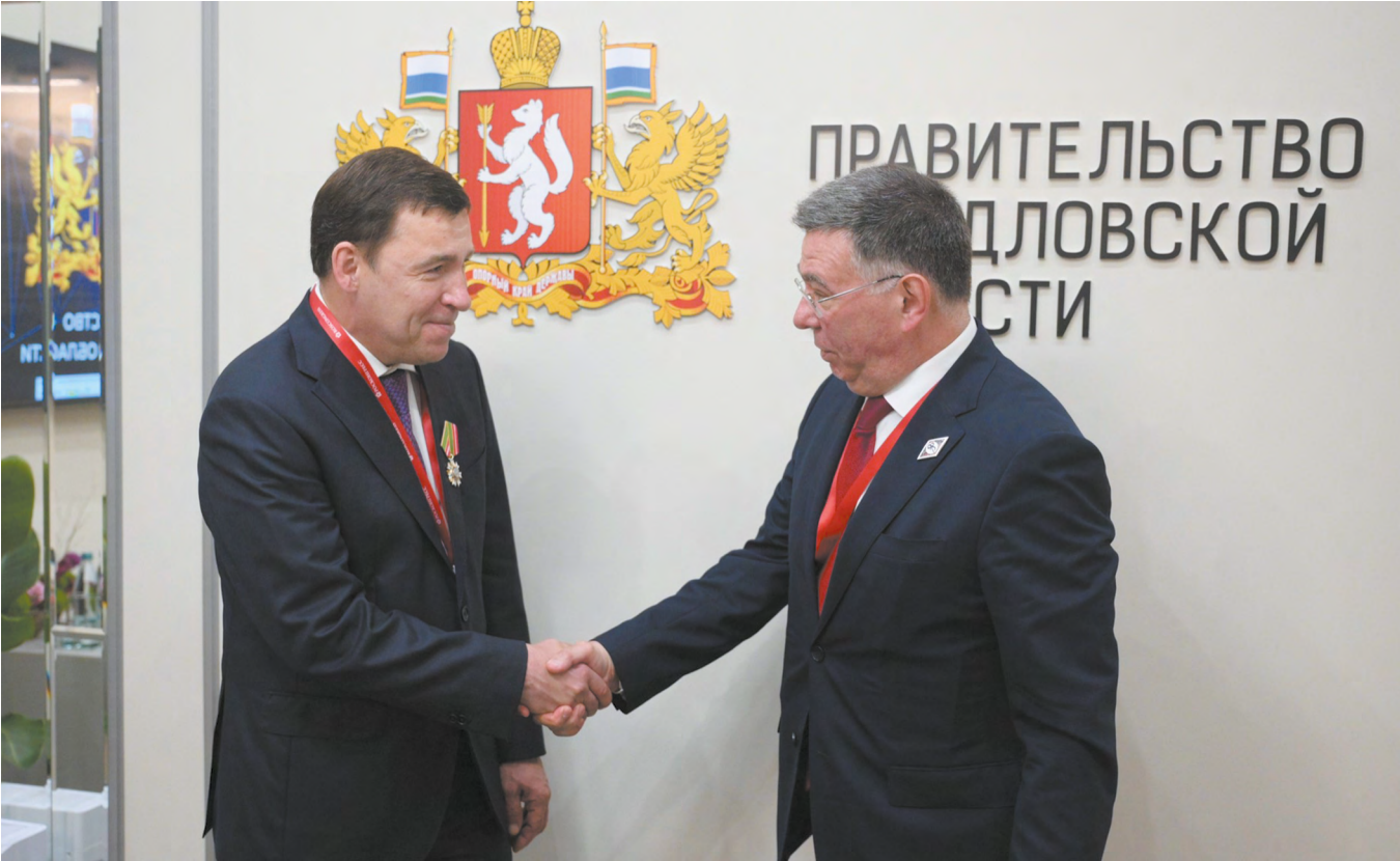
▲ Заместитель министра иностранных дел России Александр Панкин вручил губернатору Евгению Куйвашеву нагрудный знак «За вклад в международное сотрудничество».