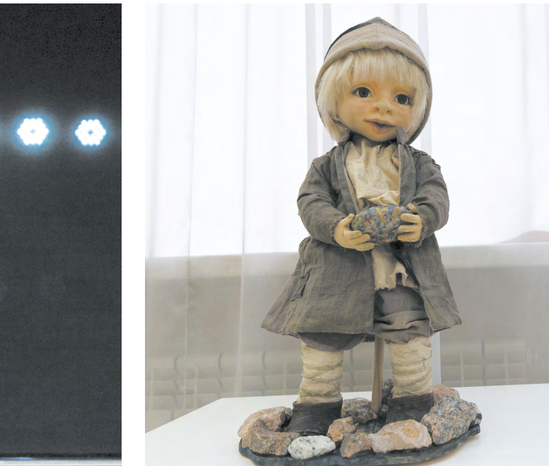
▲ Выставка по итогам VI Всероссийского конкурса авторских кукол открылась в «Доме Поклевских-Козелл».