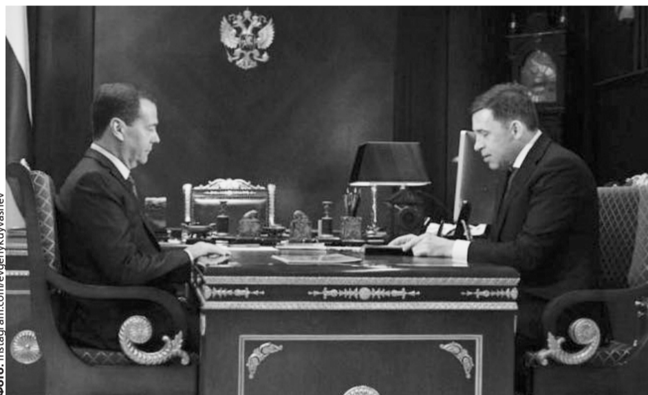
«Дмитрий Анатольевич пообещал поддержать проекты со стороны Правительства РФ», — говорится в сообщении губернатора.

Так, 3 апреля 2019 года в Екатеринбурге был создан региональный заявоч-