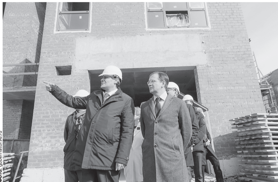
Глава Екатеринбурга Александр Высокинский рассказал министру, что «Эрмитаж-Урал» разместится в двух зданиях: культурно-просветительский центр площадью 3800 м 2 – на ул. Вайнера, 11, и фондохранилище – 2600 м 2 – на ул. Вайнера, 16.

«У нас разработаны три региональных проекта, – отметил глава региона Евгений Куйвашев. – Они нацелены на вовлечение большего количества уральцев в культурную деятельность и создание условий для раскрытия творческого потенциала людей. Так, мы планируем к