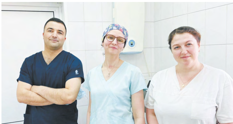
▲ Специалисты Городской больницы №4 Нижнего Тагила спасли многодетного отца из Серова, сердце которого за несколько ночных часов останавливалось трижды