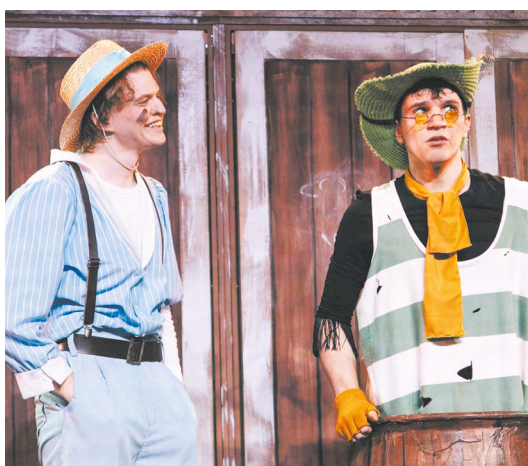
▲ Предпремьерная проверка: в «Театруме» состоялся закрытый показ спектакля «Том Сойер»