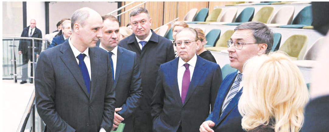
Что уже сделано, а что только предстоит. Министр науки и высшего образования РФ Валерий Фальков в сопровождении губернатора Дениса Паслера лично оценил три крупнейших свердловских вуза

Один из примеров уже проделанной работы — новая аудитория на 100 мест с необходимым оборудованием для проведения лекций в разных форматах, в том числе онлайн. Еще один важный объект — участок механической обработки с программным управлением. Здесь установлен фрезерный станок с ЧПУ для практических занятий будущих инженеров.