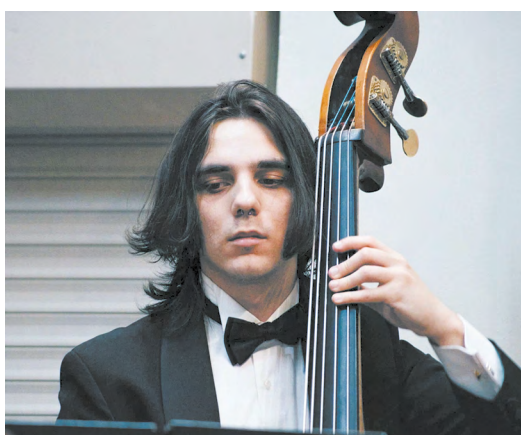
▲ Гитара + Оркестр. В Доме музыки стартовал главный камерный фестиваль этой весны