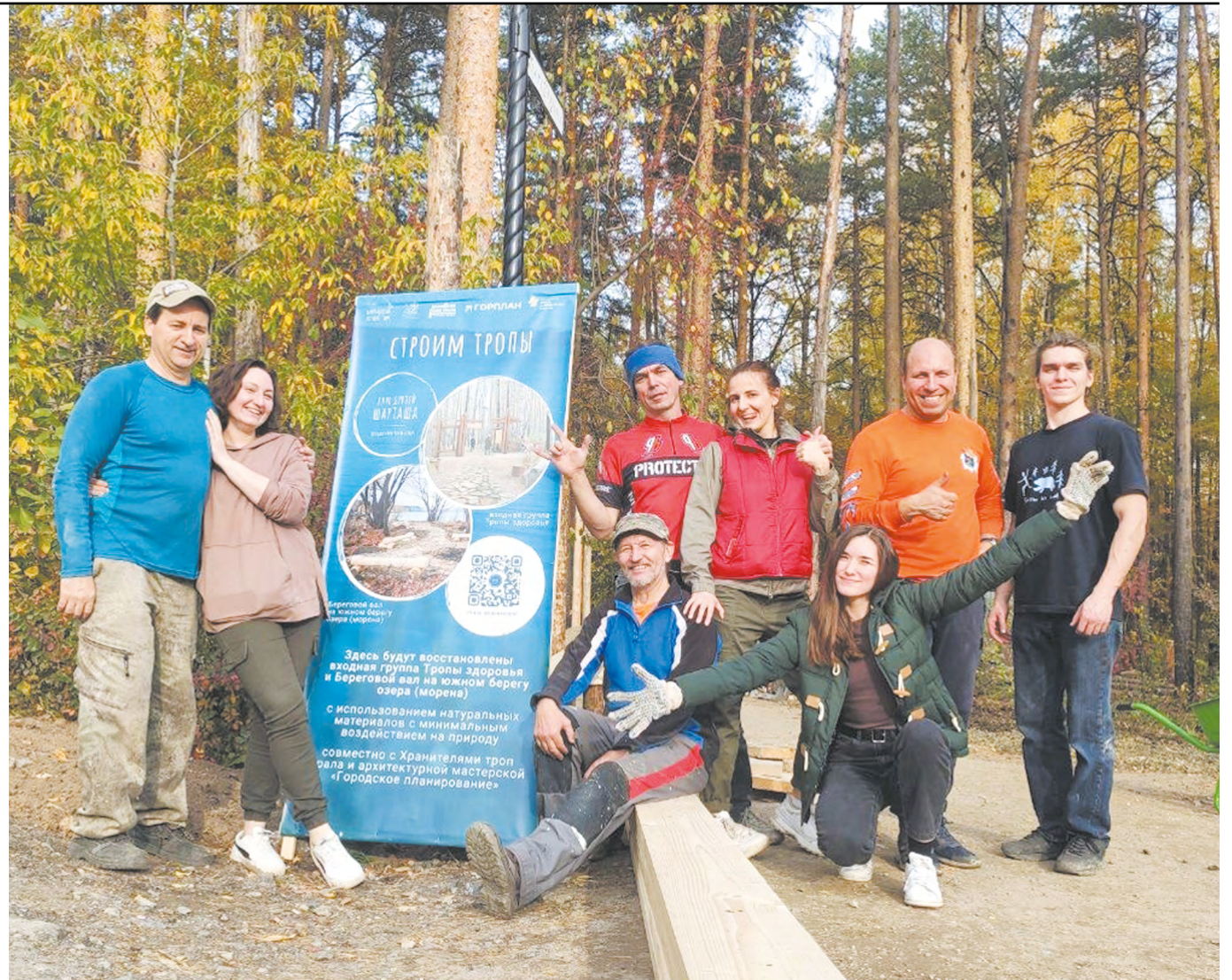
Устроители «Парковой тропы Екатеринбурга» уверены: настоящий лес не нужно «приручать», надо лишь найти тех, кто готов его полюбить и принять таким, какой он есть

– На отрезке, где расположена Ново-Свердловская ТЭЦ, никто не ходит, там все