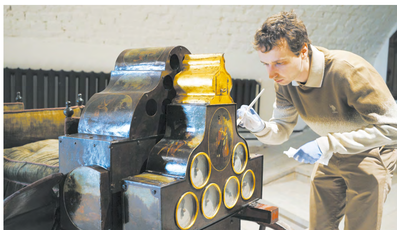
▲ Музейное закулисье: в ЕМИИ приоткрыли завесу тайны над выставками о Екатерине Великой и механических дробках