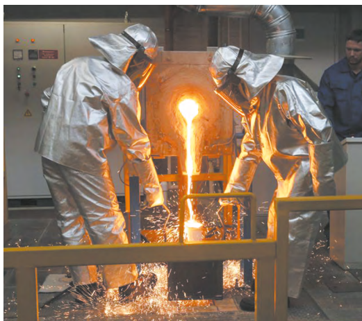
▲ Зарплаты на промышленных предприятиях Свердловской области выросли более чем на 10%