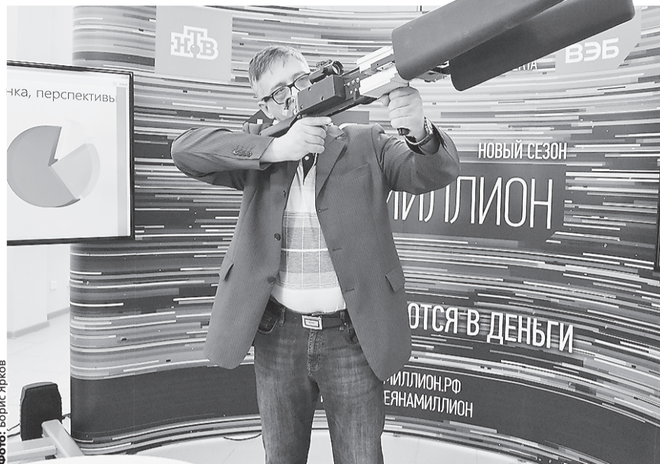
Один из проектов, представленных в Екатеринбурге, – ружье для стрельбы по беспилотникам.

Как рассказали «Уральскому рабочему» организаторы шоу, Свердловская область – одна из лидеров по количеству присланных заявок. В частности, на кастинге были представлены ружье для стрельбы по беспилотникам, интерактивная песочница для детей, автомобильная система ночного видения с дальностью обзора до 1500 метров и другое.