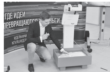
Интерактивная песочница притянет даже взрослых.

По мнению Сергея Малоземова, в уральских стартапах ему импонирует то, что большинство их авторов не полагается на помощь бизнес-инкубаторов, институтов развития, хотя участники шоу стараются