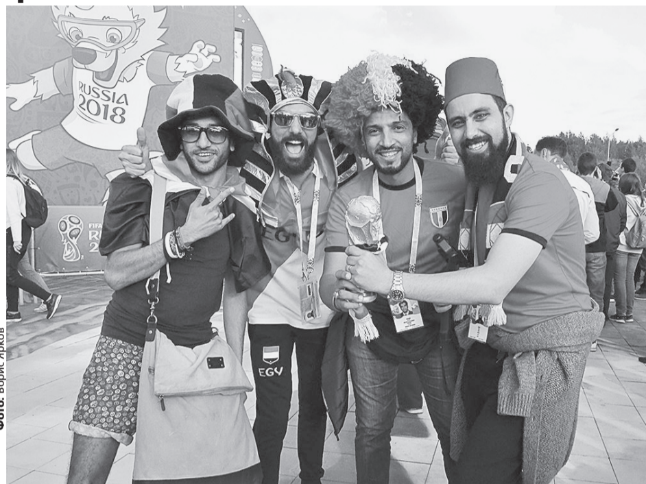
Вместе с российскими фанатами на фестиваль болельщиков приехали гости из Египта и Уругвая. Все они верят в победу своей сборной.

«Уральскому рабочему» удалось взять экспресс-комментарий у регио-