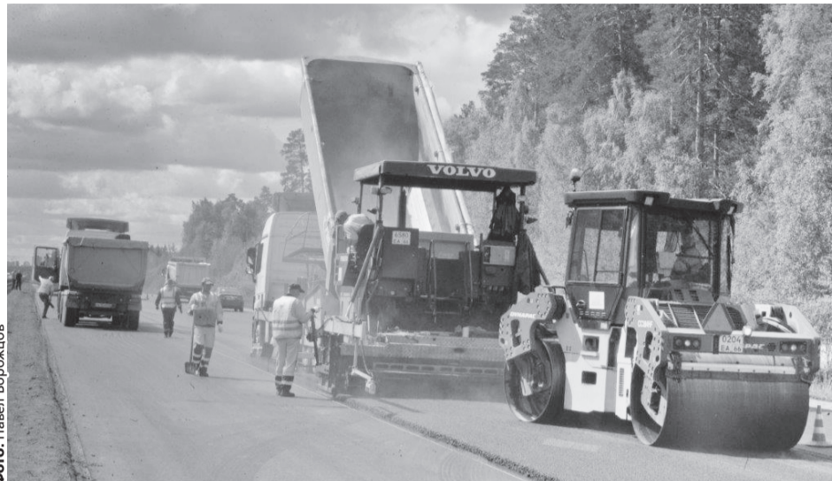
Сегодня участок Серовского тракта ремонтируется в рамках проекта «Безопасные и качественные дороги». Начальник Управления автомобильных дорог Вячеслав Данилов прокомментировал: «До 2020 года планируется привести в нормативное состояние участок тракта протяженностью 16,7 км. Из них 10 км – в нынешнем году».

Свердловская область эти задачи выполняет. По словам губернатора Евгения Куйвашева, объем регионального Дорожного фонда в 2017 году превысил 15 миллиардов рублей, из них почти 40%, а это более шести миллиардов рублей, направлено на развитие сети местных автодорог. «Среди крупных объектов отмечу ввод в эксплуатацию участка второго пускового комплекса Екатеринбургской кольцевой автодороги, реконструкцию дороги Карпинск – Кытлым, строительство подъезда к Краснотурьинску», – отметил губернатор.