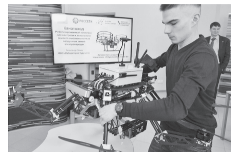
Электронный канатоход найдет повреждения на электросетях.

встраиваться в эту систему. «Главное, они полагаются на себя. И у многих есть уже сложившийся бизнес. И они стремятся к развитию», – сказал автор проекта «Идея на миллион».