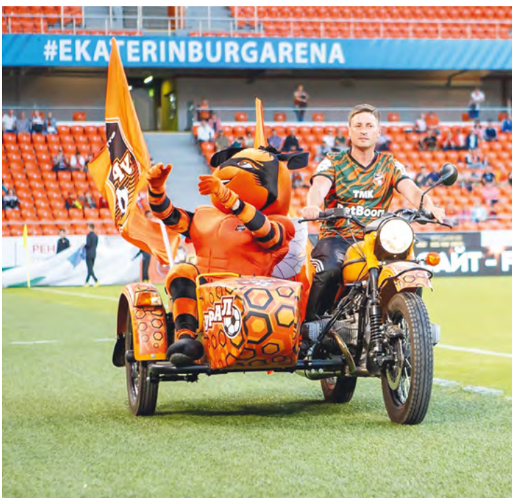
▲ Состоялся первый домашний матч ФК «Урал», где впервые в целях безопасности была применена система Fan ID. Перед игрой с «Краснодаром» паспорт болельщика в Свердловской области оформили 11 400 человек.