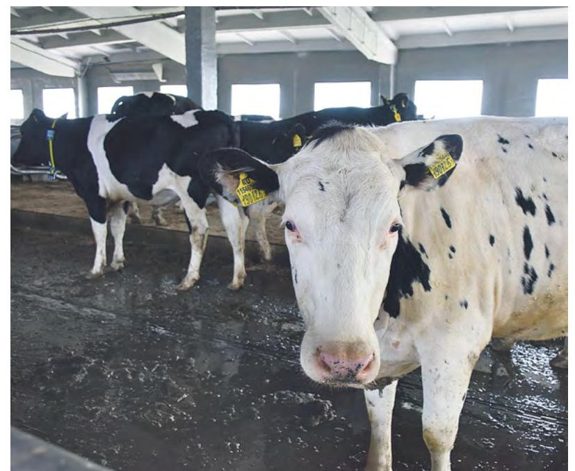
▲ Свердловские агрофирмы, занимающиеся растениеводством и животноводством, дополнительно получают почти 11 миллиардов рублей.