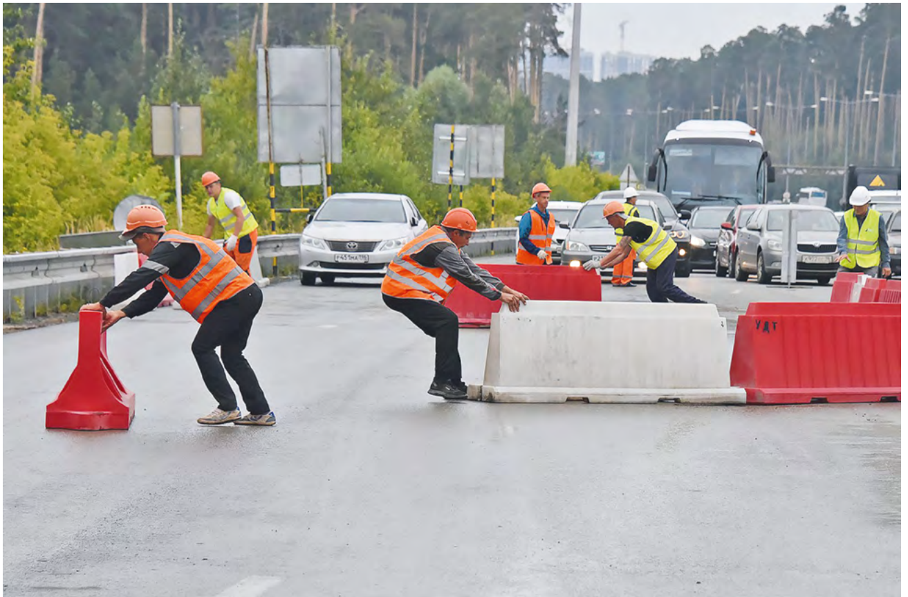
▲ Открылось сквозное движение по путепроводу на пересечении улицы Луганской с Обьездной автодорогой. На мосту, построенном в 2002 году, меняли асфальт и деформационные швы, установили водоотводы и барьеры.