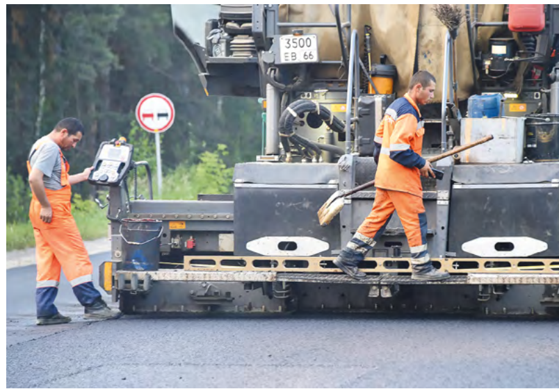
Технология укладки «вечного асфальта» полностью импортонезависима и рассчитана на применение только отечественных материалов