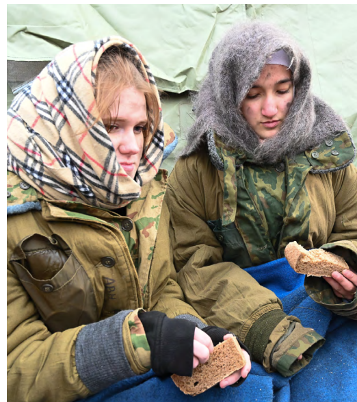
▲ Всероссийская акция «Блокадный хлеб» прошла в Екатеринбурге.