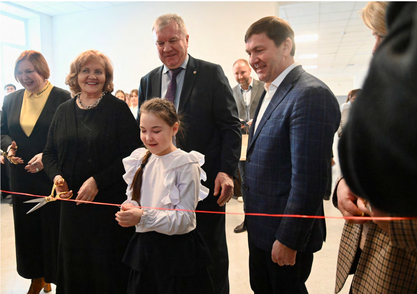
▲ Новые возможности современных школ, открывшихся в Камышлове и Талице, оценил первый заместитель губернатора Алексей Шмыков.