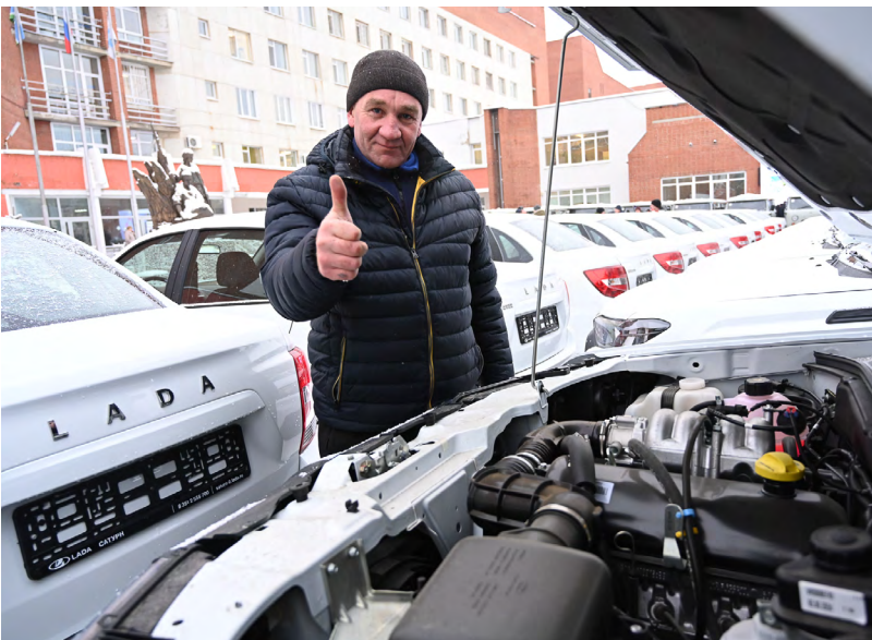
▲ Ключи от 128 новых автомобилей получили представители 44 больниц Свердловской области.