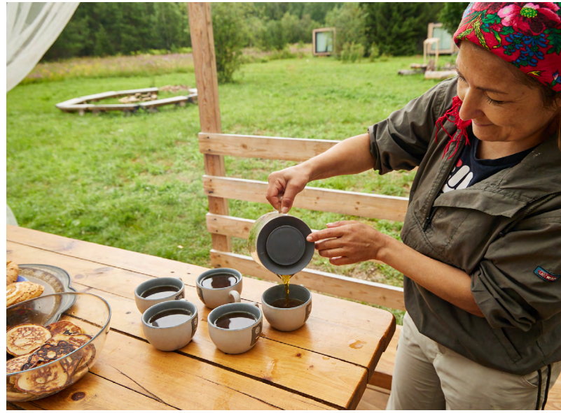
В Свердловской области действует 538 особо охраняемых природных территорий, десять из них были созданы за последние пять лет.

и парках, в Минприроды приняли решение о создании новых подобных территорий в Свердловской области.