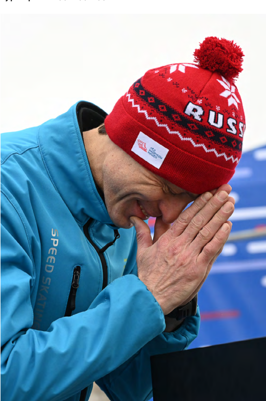
▼ Конькобежцы 23 уральских городов вышли на старт турнира «Лед надежды нашей».