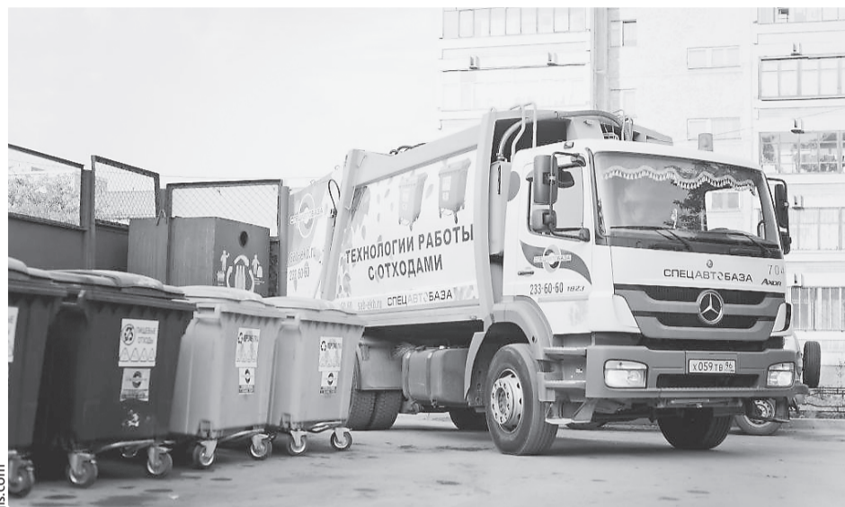
На площадках для сбора ТКО в населенных пунктах установлено более 5 000 новых контейнеров, на маршруты вышли два десятка новых мусоровозов.

на то, что регператоры выставляют счет за услугу «мертвым» душам. Дело в том, что закон о защите персональных данных не позволяет коммунальщикам наводить справки в паспортных столах, чтобы скорректировать начисления.