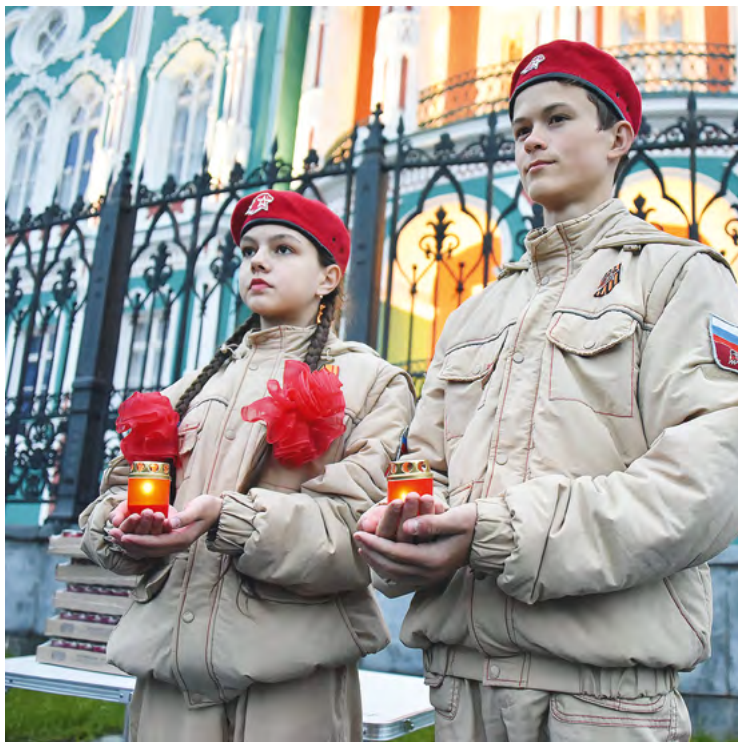
▲ В ночь на 22 июня в Екатеринбурге состоялась Всероссийская гражданская акция «Свеча памяти». Акция была приурочена ко Дню памяти и скорби – дню начала Великой Отечественной войны. Фото: Борис Ярков

▼ В Новоуральске в Центре аддитивных технологий анонсировали импортозамещение в сфере 3D-печати. На отечественных принтерах начали изготавливать уникальные по своей сложности детали. Фото: Борис Ярков