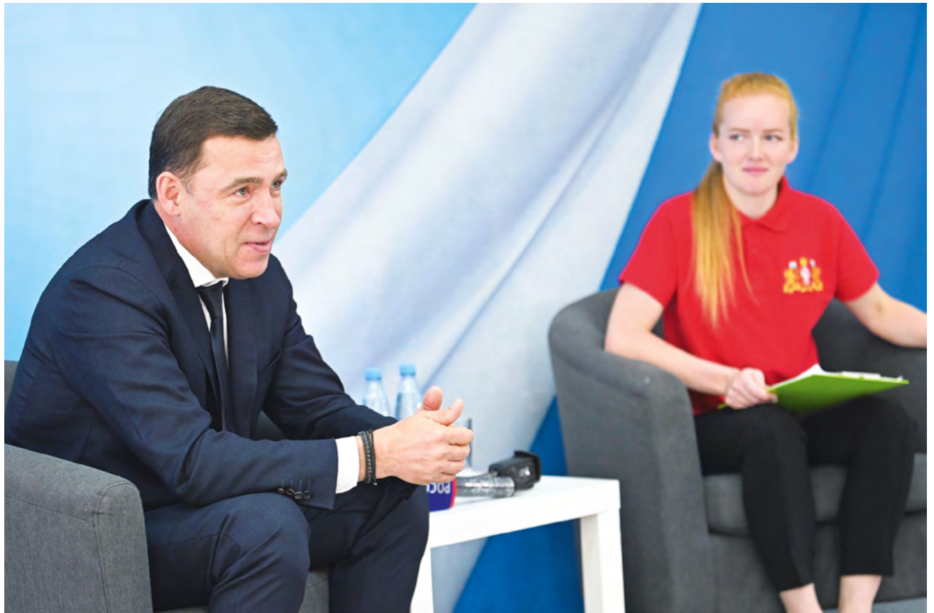
▲ «Доброжелательность, честность. Умение и желание понимать – чем больше делаешь добра, тем больше получишь», – назвал губернатор Евгений Куйвашев главные качества добровольца на встрече с волонтерами.