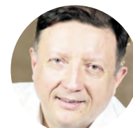
Сергей Радченко, заместитель министра культуры Свердловской области

«Сегодня в нашем регионе открыто 162 школы самого разного направления: художественные, музыкальные, театральные, хореографические и другие. Это много, по их количеству мы занимаем третье место в стране. Что важно, в этом направлении у нас создана