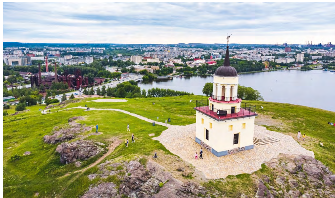
«К этой знаковой юбилейной дате мы готовились несколько лет. Работа проведена очень большая. Позитивные изменения коснулись практически всех сфер жизни города и самих тагильчан», – отметил губернатор Евгений Куйвашев