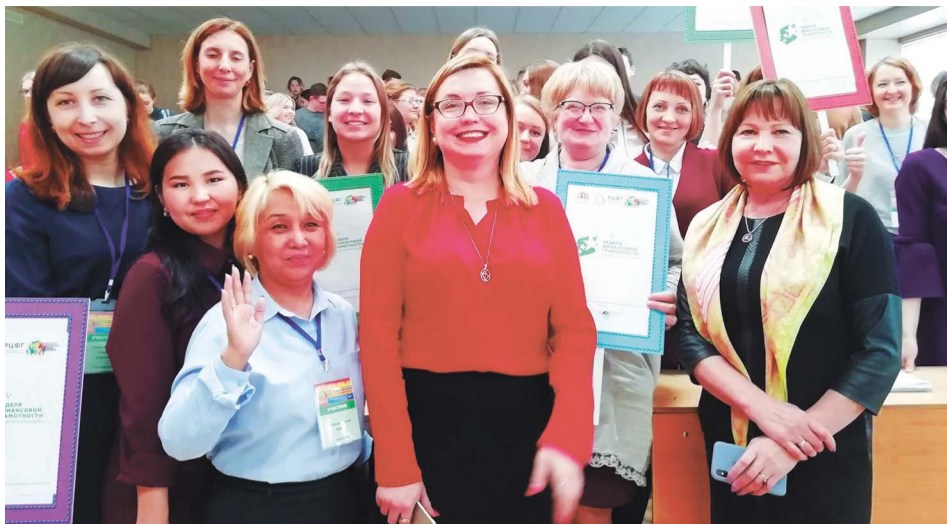
В региональном Центре финансовой грамотности, созданном по соглашению между правительством Свердловской области и УрГЭУ, правильно обращаться с финансами учат представителей всех возрастных групп