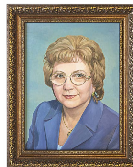
Мария Александровна Серова, министр финансов Свердловской области с июля 2003 года по декабрь 2009 года.