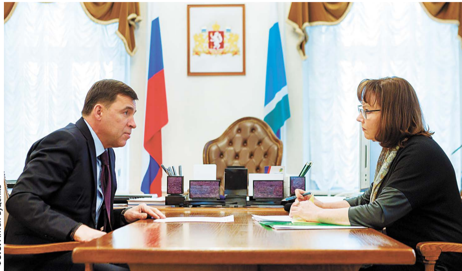
Галина Кулаченко докладывает губернатору Евгению Куйвашеву о финансовых итогах года

— Я считаю, что социальный лифт — это в первую очередь большой интерес к работе и желание совершенствоваться