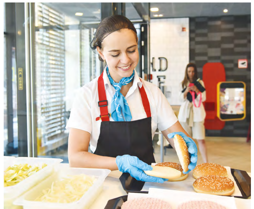
▲ На месте ушедшей из России сети McDonald's открылись отечественные рестораны «Вкусно — и точка», наладившие выпуск «импортзамещенных» кулинарных аналогов.