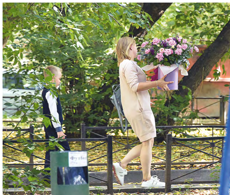
1 сентября 2023 года в свердловские школы пойдут 56 тысяч первоклассников

репрессий 1937 года, и в военные годы, и после войны. Тяжелейшее время, но то, что она делала, было примером для всей семьи. У нее было восемь детей, и шесть из них стали педагогами».