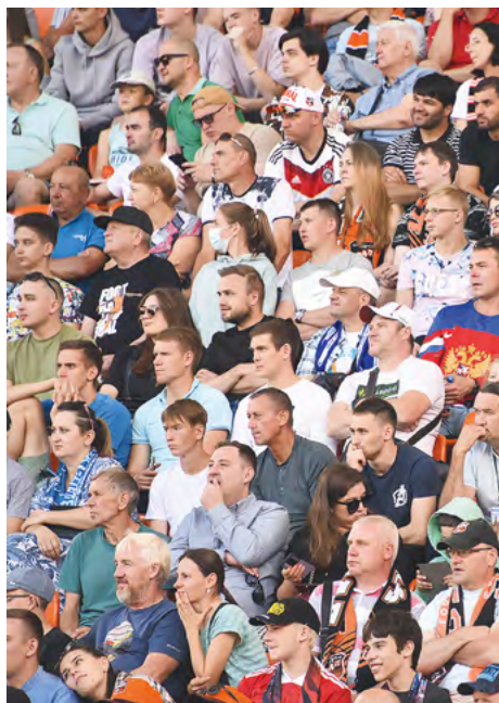
▼ Перед матчем «Урал» — «Зенит» 24,4 тысячи свердловчан оформили карты болельщика.