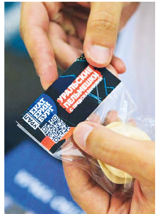
▲ День Большого Урала в московском парке «Зарядье» посетили несколько тысяч гостей.