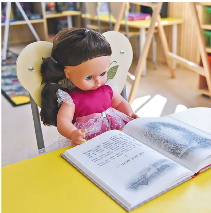
▲ Два новых детских сада открылись в Екатеринбурге после капитального ремонта. Их воспитанниками станут 270 ребят.