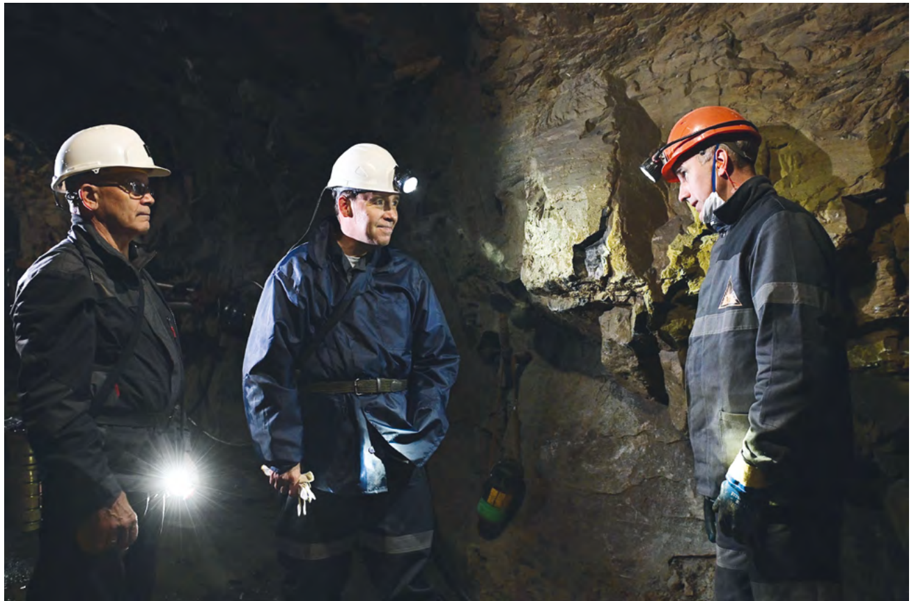
▲ Губернатор Евгений Куйвашев обсудил с работниками Березовского рудника развитие горнодобывающей отрасли. Во время рабочего визита на предприятие глава региона спустился в шахту Северная до горизонта 512 метров.