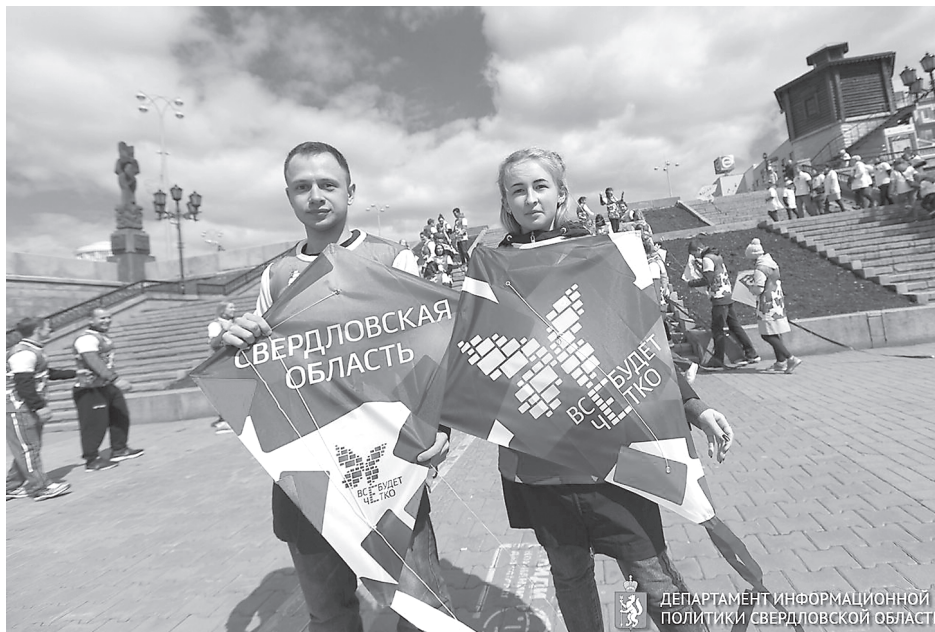
Цифровые технологии входят в повседневность каждого уральца. В Екатеринбурге 25 мая волонтеры запустили в небо 22 «цифровых» воздушных змея. Так Свердловская область присоединилась к флеш-мобу, посвященному переходу на цифровое телевидение.