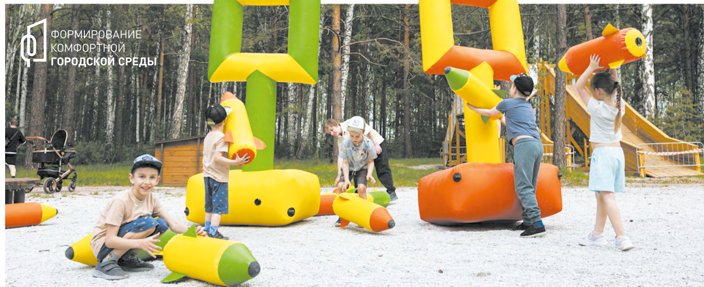
Только от жителей зависит, будет ли так же красиво там, где они привыкли проводить свободное время

В Нижнем Тагиле, например, главным событием стал IX фестиваль-парад «Аккорды лета», который прошел на Театральной площади и в парке имени А. П. Бондина. Гостей ждали выступления оркестра «Тагил-бэнд», сводное исполнение композиции «Пусть всегда будет солнце» и дебют новых музыкальных коллективов. Здесь и Театральная площадь, и Театральная сквер участвуют во всероссийском голосовании за объекты благоустройства в рамках национального проекта «Инфраструктура для жизни».