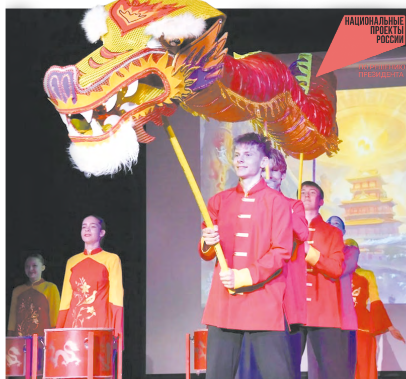
Проект международного молодежного лагеря «Город дружбы» реализуется по нацпроекту «Молодежь и дети», организатором его выступил фонд «Золотое сечение» при поддержке министерства образования Свердловской области.

В чудесном «Городе дружбы» российские и китайские школьники от 14 до 17 лет познакомятся с культурой, историей, возможностями образования и молодежной политики двух стран. Ребята будут изучать традиции друг друга, занимаясь на мастер-классах лепкой русских и китайских пельменей, изготовлением традиционных изделий из глины, художественной росписью, позируя в русских народных костюмах и еще много чем интересным. Впереди их ждут лекции и интерактивные занятия по стратегическому партнерству России и Китая, образовательная программа по семи тематическим направлениям: «Культура», «Международное сотрудничество», «Инновации и развитие территорий», «Образование», «История и патриотическое воспитание», «Медиакоммуникации» и «Спорт», посещение Уральского федерального университета.