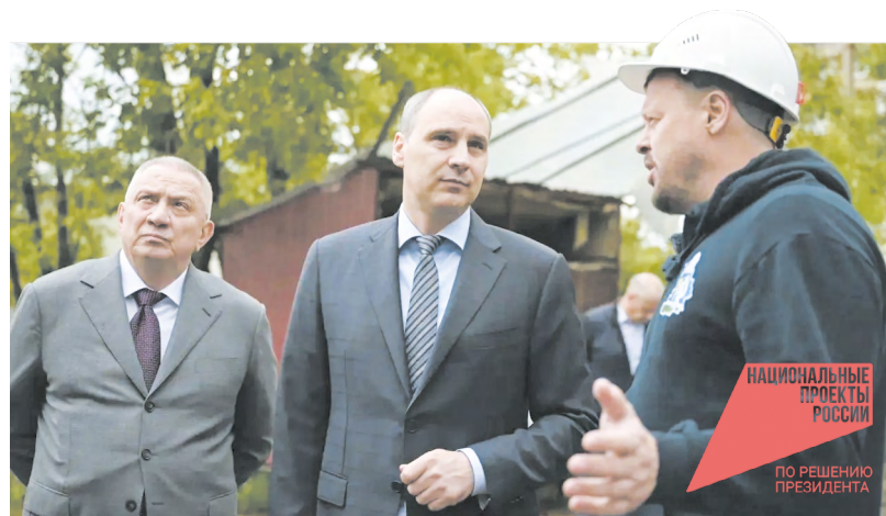
Социальное партнерство в действии: губернатору Денису Паслеру представители «Хромпика» показали, как завод помогает развивать город

Завод «Хромпик» входит в Группу компаний «Полипласт». Это крупнейший российский специализированный холдинг по выпуску наукоемких химических продуктов собственной разработки для различных отраслей промышленности. Производство компании отвечает задачам нацпроекта «Новые материалы и химия».