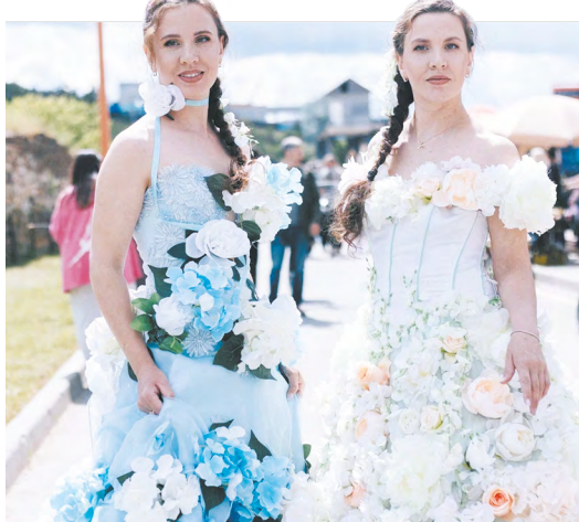
▲ Завод расцветает. В Сысерти стартовал седьмой сезон фестиваля «Лето на заводе»