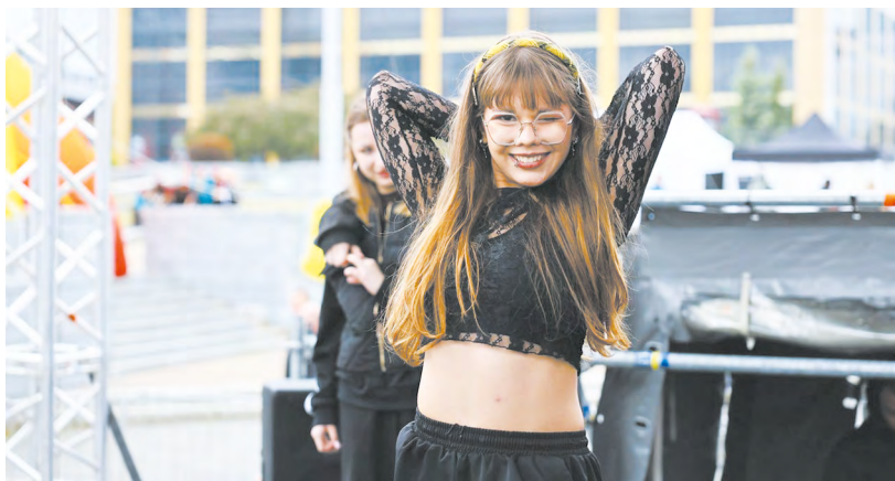
▲ От жарких батлов к туристическим тропам: уральская столица стала площадкой для фестиваля молодежного туризма «Весенний маршрут» и проекта уличного танца «Улицы ЕКАТа»