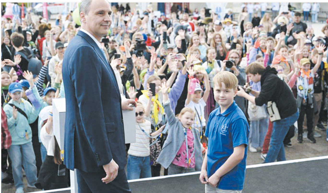
▲ Денис Паслер открыл семейный фестиваль детства «ТЕХНОполюшко». Глава региона подчеркнул, что в области создается прочный фундамент для воспитания будущих IT-специалистов