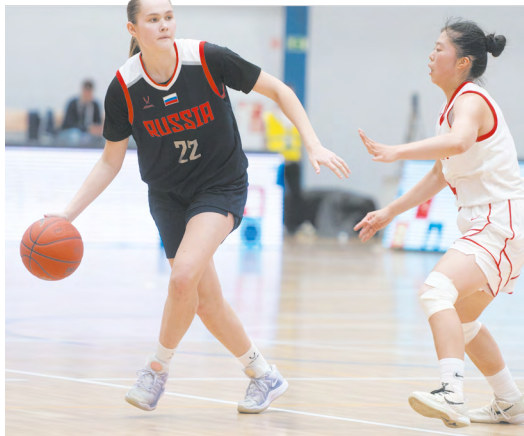
▲ Семь наград привезли свердловчане с X Российско-Китайских молодежных летних игр