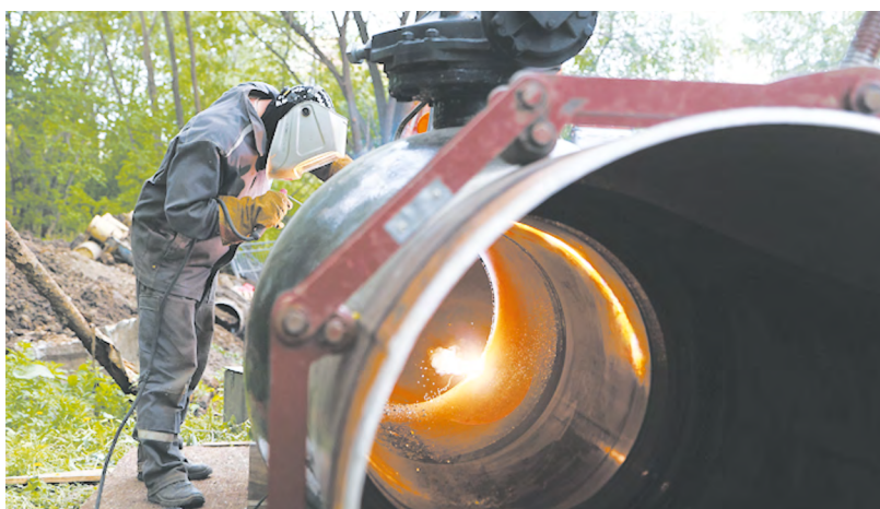
▲ Готовы сани с лета, а трубы – к зиме: стартовала подготовка газового хозяйства Екатеринбурга к новому осенне-зимнему сезону