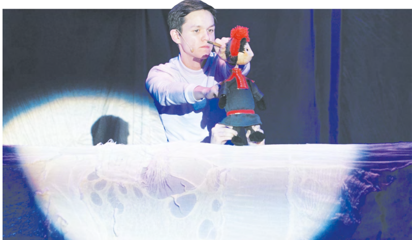
▲ В Екатеринбургском театральном институте состоялся специальный показ, приуроченный к 1 июня – Международному дню защиты детей