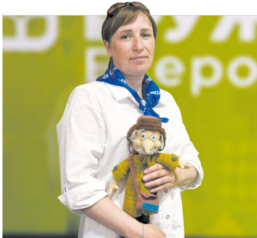
▲ Вязаный Печкин и настоящий триумф: как уральцы покорили жюри «Земского почтальона»