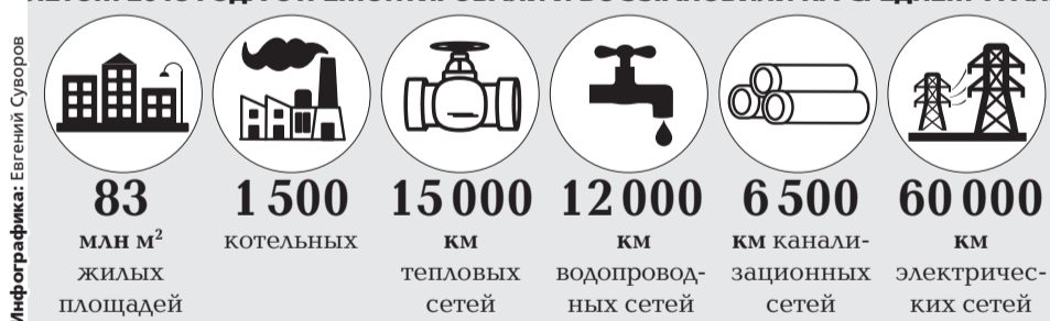
Инфографика: Евгений Суворов