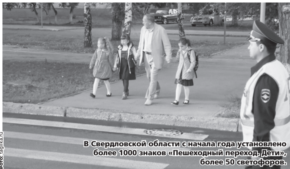
В Свердловской области с начала года установлено более 1000 знаков «Пешеходный переход. Дети», более 50 светофоров.

Напомним, в школы Среднего Урала 1 сентября отправились 488 тысяч детей, из которых 58 тысяч — первоклассники.