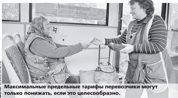
Максимальные предельные тарифы перевозчики могут только понижать, если это целесообразно.

Так, для установления индивидуальных тарифов на перевозку пассажиров и багажа в РЭК обратилась компания «Транспорт» (Богданович) и глава ГО Богданович. В июле индивидуальные предельные тарифы на перевозку пассажиров и багажа утверждены РЭК в размере 20 рублей за поездку и за место багажа в городском сообщении и 2,30 рубля за километр — по муниципальным маршрутам регулярных перевозок на территории ГО Богданович и межмуниципальным маршрутам регулярных перевозок.