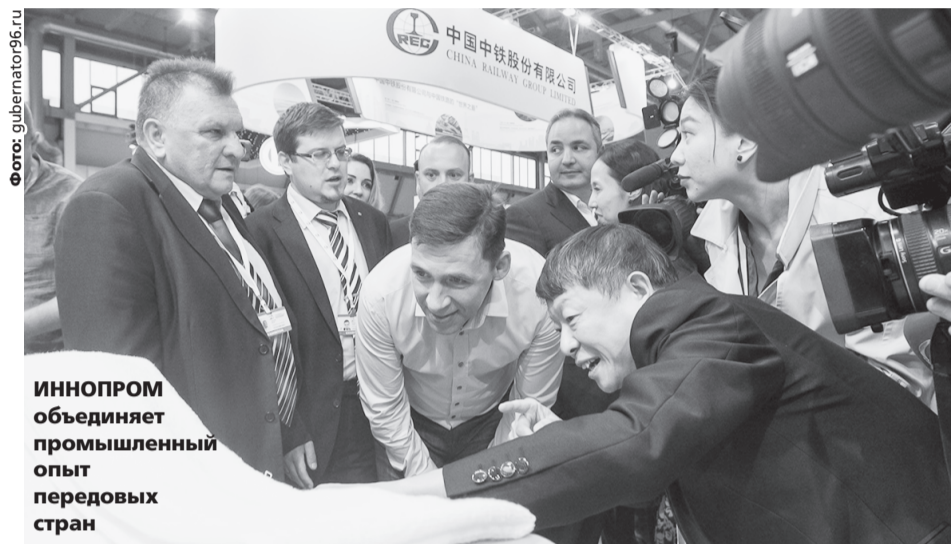
ИННОПРОМ объединяет промышленный опыт передовых стран

Лето 2018 года выдалось для Свердловской области насыщенным. В Екатеринбурге только что прошли матчи группового этапа ЧМ-2018. Не успели мы проводить спортсменов и многочисленных болельщиков, как уже встречаем новых гостей сразу двух статусных международных форумов – ИННОПРОМа и Российско-Китайского ЭКСПО.