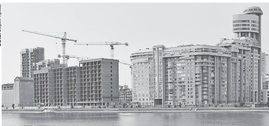
В 2017 году уральцы построили 2 144 000 м 2 жилья

Новые требования коснутся тех застройщиков, которые ведут работы с привлечением средств по договорам участия в долевом строительстве. В частности, запрещается прямая продажа жилья в строящихся домах. У застройщика теперь будет несколько вариантов продажи квартир: или через банковское сопровождение — в отношении каждого разрешения на строительство застройщику необходимо открыть расчетный счет в уполномоченном банке (перечень утвержден Центробанком), или через так называемые счета эскроу. Счет эскроу — это резерв, на котором до момента сдачи дома в эксплуатацию хранятся деньги дольщика, застройщик ими не пользуется, рассчитывая при строительстве на другие ресурсы, например, кредит. Эти средства блокируются банком, на них не начисляются проценты по отношению к дольщику. Они страхуются. Сумма страховых выплат — до 10 миллионов рублей.