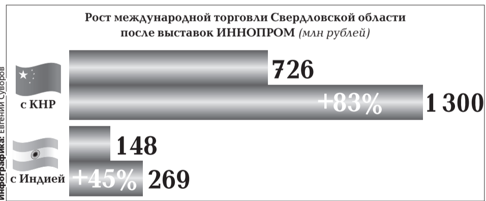
Инфографика: Евгений Суворов

жиропотоками, «умная среда» – благоустройству и сфере ЖКХ, «умная экономика» – сфере производства, торговле, логистике, финансам и строительству, «умные сервисы для бизнеса» представляют проекты КРСУ, «Титановой долины», фонда поддержки предпринимательства и технопарка «Университетский». Еще два блока «умные люди» и «умный образ жизни» посвящены образованию, изобретательской активности, креативности и здравоохранению, безопасности, культуре и туризму.