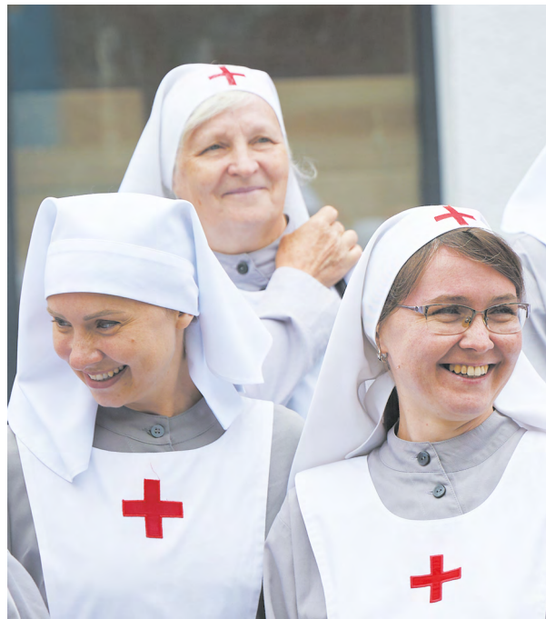
▲ В Екатеринбурге готовится к открытию Свято-Елисаветинская обитель милосердия – хоспис, где будут круглосуточно ухаживать за тяжелобольными.