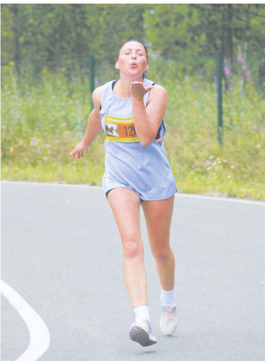
▼ Легкоатлетический пробег «Егоршинская десятка» в Артемовском собрал рекордное число участников.