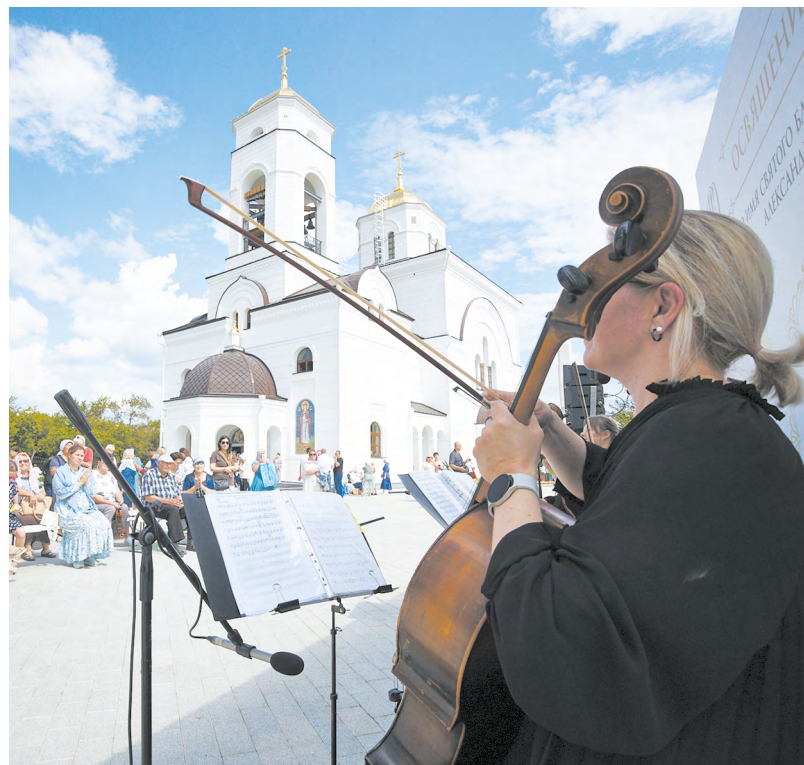
▲ В Алапаевске в рамках «Царских дней» в присутствии трех тысяч уральцев открыли храм Александра Невского.