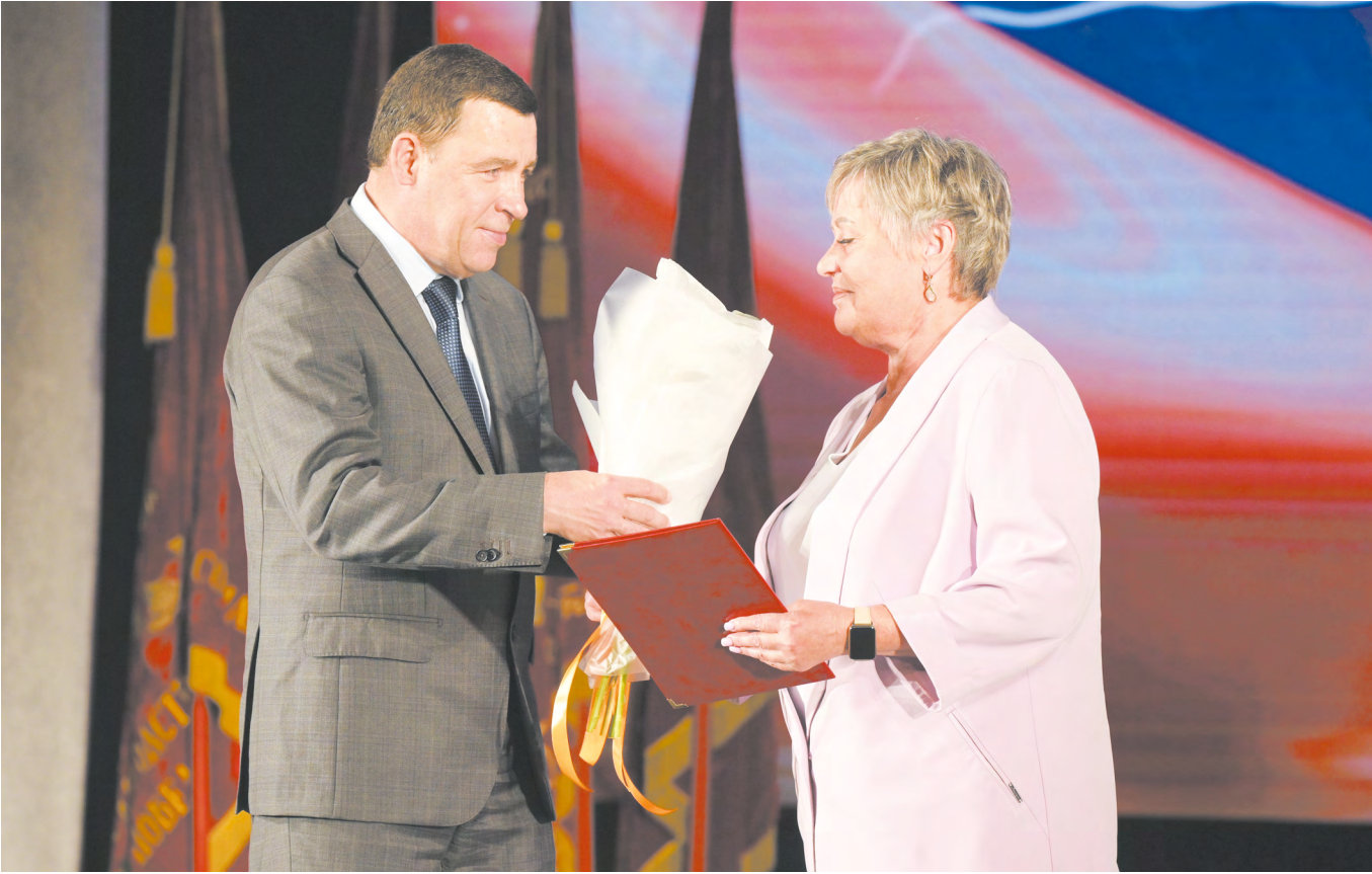
▲ Евгений Куйвашев наградил выдающихся уральских металлургов накануне профессионального праздника.