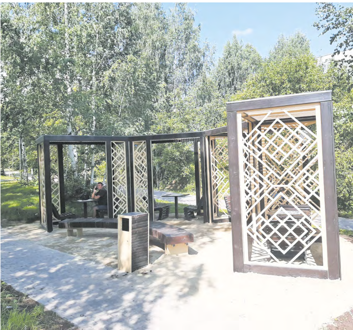
▲ В Кировграде завершено благоустройство улицы Свердлова, проект которого был победителем Всероссийского конкурса малых городов и исторических поселений.