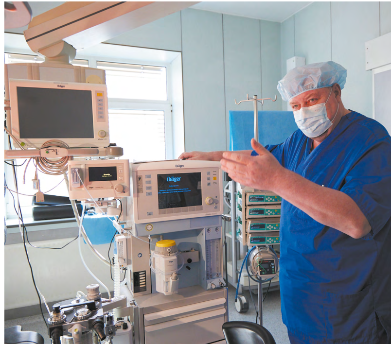
Технологического потенциала местных клиник сегодня достаточно, чтобы проводить крайне редкие и сложные операции.

нов рублей по федеральной программе «Приоритет-2030». Деньги распределены по разным направлениям, одним из которых стало расширение производства радиофармпрепаратов для диагностики и лечения онкозаболеваний. Для их изготовления два года назад в УрФУ заработал циклотронный центр ядерной медицины.